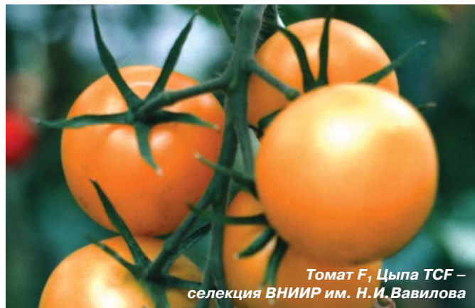
Томат F, Цыпа TCF – селекция ВНИИР им. Н.И.Вавилова

В настоящее время коллекция овощных и бахчевых культур насчитывает свыше 50 тыс. образцов; из них дикорастущие виды, староместные и современные сорта, а также генетические источники с идентифицированными генами. Ежегодно селекционерам передается в качестве исходного материала от 1000 до 1500 коллекционных образцов. Учитывая, что большое значение уделяется созданию гетерозисных гибридов, в последние годы усилены исследования генетического потенциала, сосредоточенного в коллекции ВИР, с использованием современных методов. С этой целью идентифицированы геноресурсы и создана генетическая коллекция, насчитывающая около 1300 образцов. Идентифицированный генофонд является также основой для создания доноров селекционно-важных признаков, использование которых обеспечит прогресс селекции в создании сортов и гибридов овощных и бахчевых культур, наиболее полно удовлетворяющих требованиям сельскохозяйственного производства.