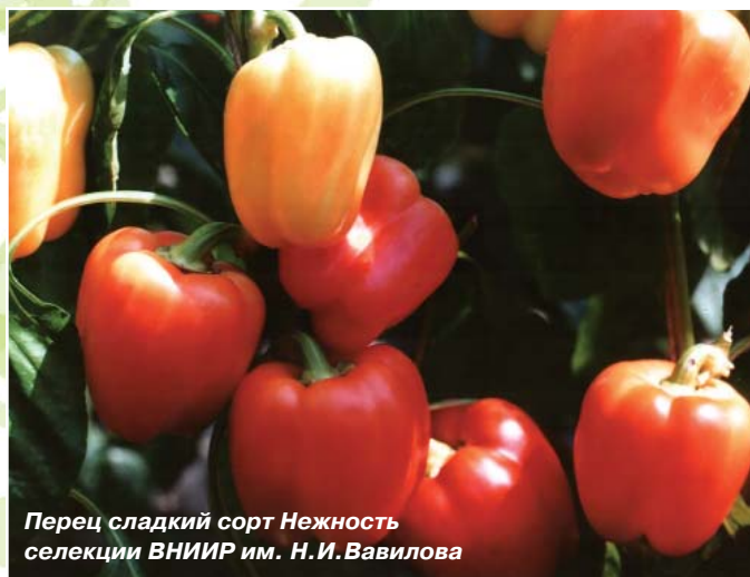
Перец сладкий сорт Нежность селекции ВНИИР им. Н.И.Вавилова

В последние годы проводится углубленное изучение генетического разнообразия овощных и бахчевых культур: идентификация и картирование QTL морфологических и фенологических признаков картирующих популяций капусты китайской и репы; филогенетические исследования генофонда капусты с помощью молекулярных маркеров (совместно с Германией); скрининг образцов дыни на устойчивость к болезням (совместно с Нидерландами); скрининг коллекции капусты на устойчи-