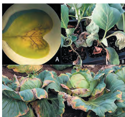
Рис.1. Симптомы сосудистого бактериоза: А – на семядольных листьях, В – на рассаде, С – на взрослых растениях, (фото автора). Fig.1. Symptoms of black rot of brassicas: А – on the cotyledon leaves, В – on cabbage seedling, С – on adult plant (photo by the author).

Поражение капустных растений проявляется на всех стадиях выращивания культуры: всходы, рассада и взрослые растения. При сосудистом бактериозе на семядольных листочках образуются водянистые пятна бурого цвета, в дальнейшем приводящие к некротизации сосудов, засыханию семядолей и последующей гибели всходов (рис.1А). У взрослых растений симптомы заражения обычно заметны у края листовой пластинки в виде V-образных хлоротичных пятен, вследствие проникновения бактерий через гидатоды (рис.1С). На пожелтевшей ткани листа, на срезе черешка или кочерыги также хорошо заметна некротизация сосудов [5]. При одностороннем поражении лист искривляется в эту сторону, приобретая уродливую форму [1] (рис.1В). В дальнейшем бактерии попадают в стебель и распространяются по нему вверх и вниз к листьям и корням. При системном инфицировании хлоротичные участки могут появляться в любом месте на листьях. Вследствие развития заболевания зараженные листья могут преждевременно опадать.