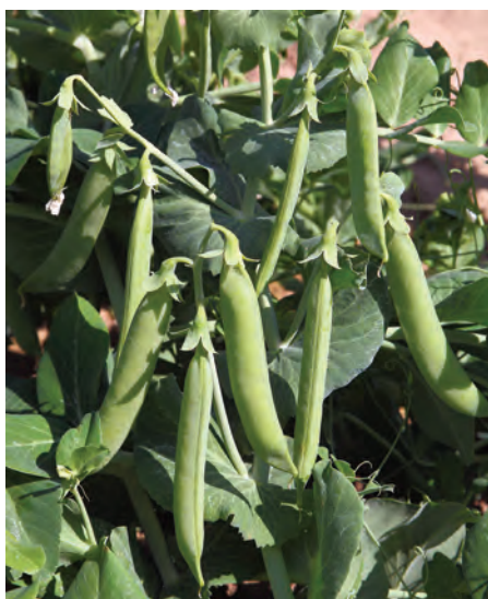
Рис. 1. Селекционный номер 102-82A 5 B 4