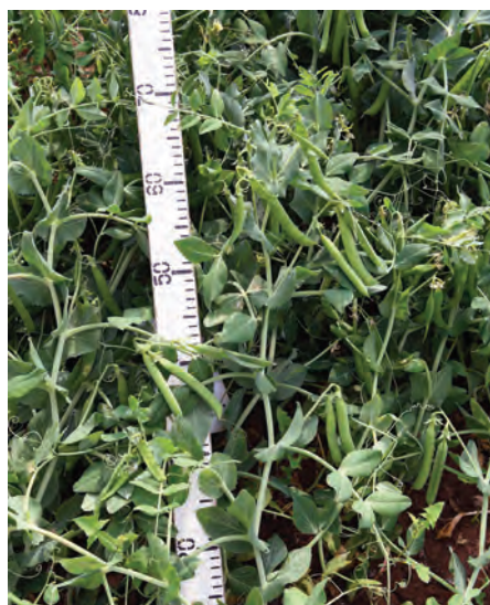
Рис. 3. Селекционный номер 16-05