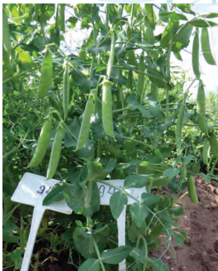
Рис. 6. Линии, устойчивые к полеганию

Сортообразец Тройка отобран из образца от ступенчатой гибридизации в лаборатории бобовых культур (авторы – Пронина Е.П., Котляр И.П.). Позднеспелый