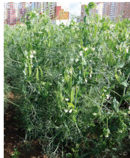
Рис. 4. Селекционный номер CM-10M