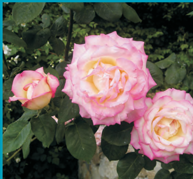
Сорт Николай Гартвис