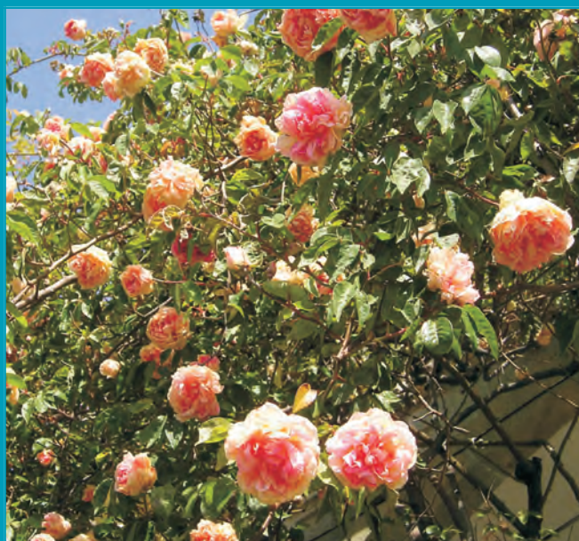
Сорт Графиня Воронцова