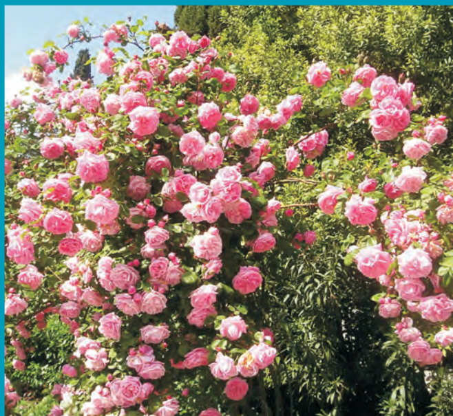
Сорт Весенняя Заря