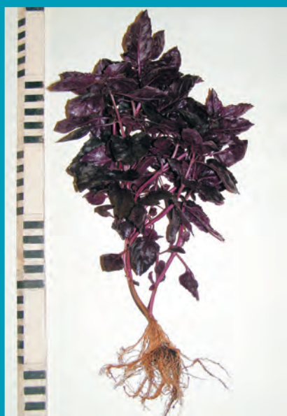
Рис. 23. Базилик сорт Фиолетовый блеск

после полных всходов. Расположение листьев в розетке вертикальное, что облегчает уход и меньше загрязняет листья после дождя. Листья зеленой окраски размером 17-19 см. Урожайность листьев составляет 3,6-3,8 кг/м 2 . Сорт характеризуется высоким выходом товарной зелени, урожайностью, вкусовыми качествами. Сорт предназначен для выращивания на зелень в открытом и защищенном грунте (рис.15).