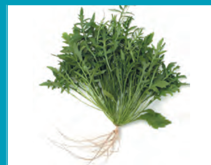
Рис. 20. Двурядник тонколистый сорт Деликатес