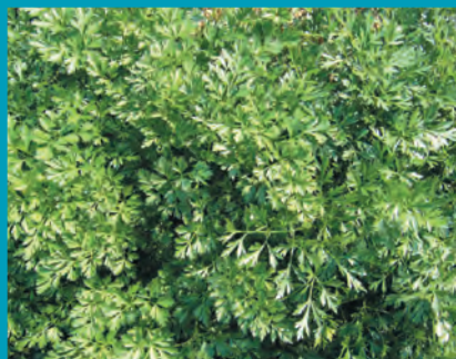
Рис. 11. Петрушка сорт Нежность