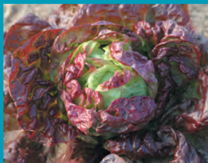
Рис. 5. Салат сорт Фонарик

Листовые и пряные овощи являются самым простым и доступным источником витаминов, антиоксидантов и биологически активных веществ, необходимых для сохранения здоровья человека. При этом обеспеченность населения листовыми и пряными овощами составляет всего 30-34% от рекомендованной нормы (20,4 кг в год на одного человека) [10].