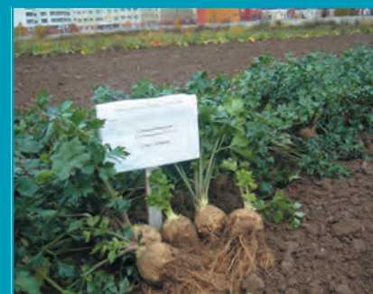
Рис. 17. Сельдерей сорт Добрыня