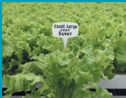
Рис. 1. Салат сорт Букет