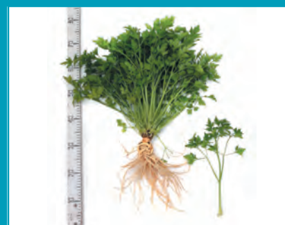
Рис. 10. Петрушка сорт Москвичка