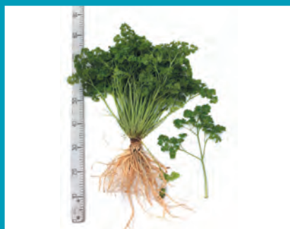
Рис. 13. Петрушка сорт Красотка