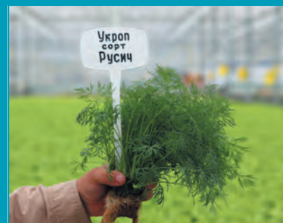
Рис. 7. Укроп сорт Русич