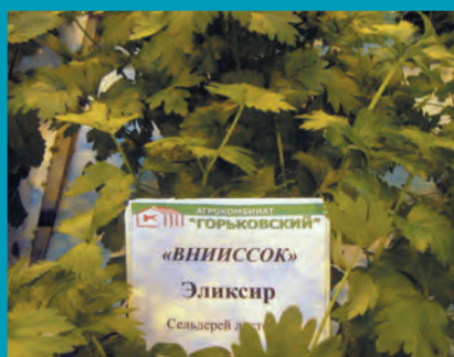
Рис. 15. Сельдерей сорт Эликсир

Букет – листовый, раннего срока использования (от посева до хозяйственной годности 45-50 суток), маслянистого типа с ярко-зеленой окраской листьев. Розетка листьев приподнятая, декоративная, очень плотная. Устойчив к высоким температурам при выращивании, но лучшие результаты проявляет в весенней и летне-осенней культуре. Сорт пластичен и пригоден для выращивания в открытом, защищенном грунте и проточной культуре. Урожайность – 3,3 кг/м 2 и более (рис.1).