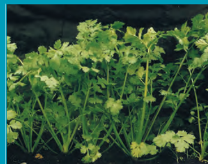
Рис. 9. Кориандр сорт Стимул