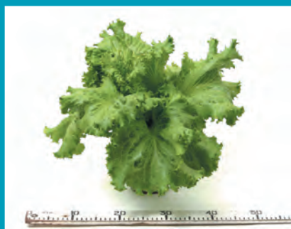
Рис. 2. Салат сорт Кавалер