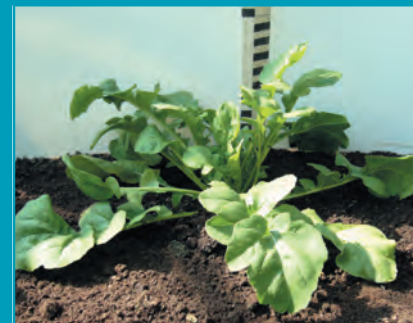
Рис. 19. Индау посевной сорт Русалочка