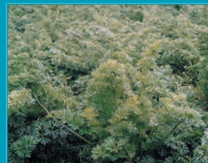
Рис. 16. Сельдерей сорт Самурай

Эликсир – среднеспелый сорт листовой разновидности. Начало хозяйственной годности наступает на 75-80 сутки