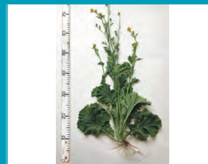
Рис. 18. Горчица салатная сорт Сударушка