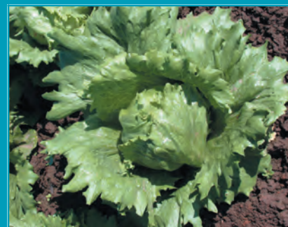
Рис. 6. Салат сорт Колобок

В ФГБНУ «Федеральный научный центр овощеводства» создано большое разнообразие сортов салата для открытого и защищенного грунта. В открытом грунте хорошо зарекомендовали себя ранне- и среднеспелые сорта листового типа: Московский парниковый, Кучерявец Грибовский, Букет, Кавалер, Синтез с зелеными листьями, а также Анапчанин, Ривьера – с окрашенными антоцианом листьями. Из кочанных сортов наибольшее распространение получили сорта хрустящего типа: Крупнокочанный, Колобок, а из маслянистых кочанных: Опал, Подмосковье. Для защищенного грунта с разными условиями и технологиями выращивания наиболее перспективны сорта: Кавалер, Синтез, Букет, дающие в проточной культуре наибольший выход зелени с единицы площади.