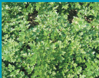
Рис. 12. Петрушка сорт Бриз