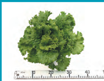
Рис. 3. Салат сорт Синтез