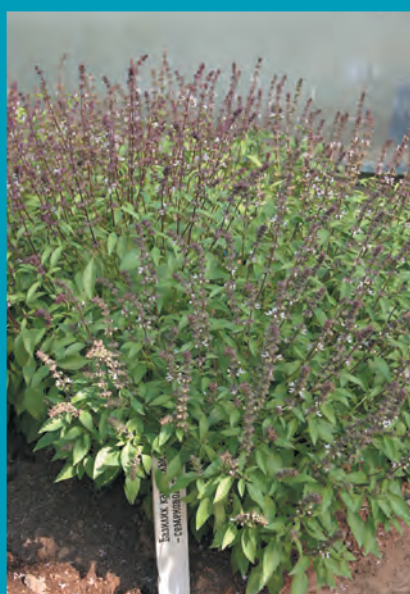
Рис. 22. Базилик сорт Карамельный