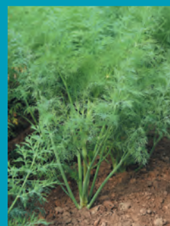
Рис. 8. Укроп сорт Спартак