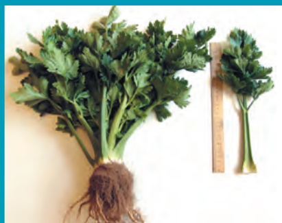
Рис. 14. Сельдерей сорт Атлант