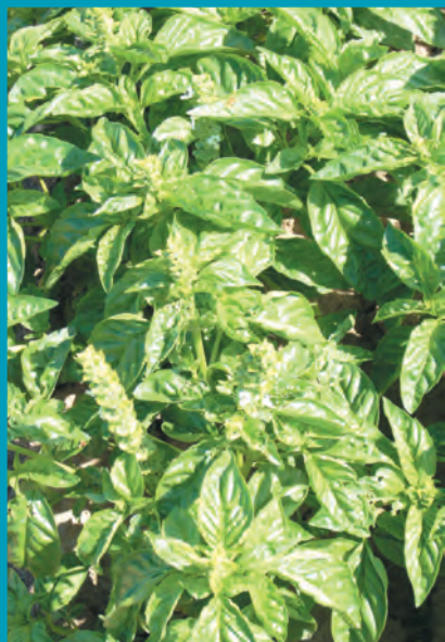
Рис. 21. Базилик сорт Гвоздичный