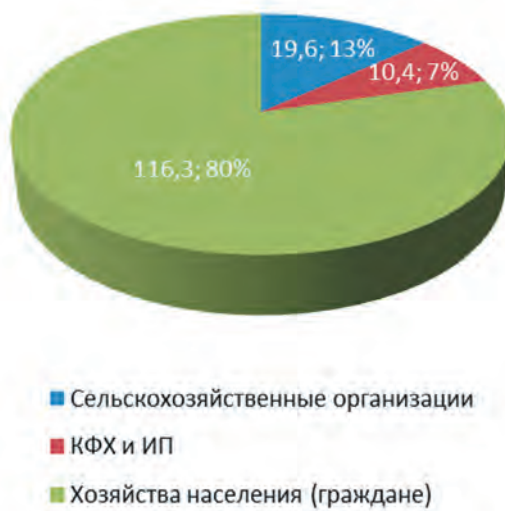
Рис. 1. Валовой сбор сельскохозяйственных культур по категориям хозяйств Иркутской области в 2017 году, тыс. т [9]. Fig. 1. Gross harvest of agricultural crops by categories of farms in the Irkutsk region in 2017, thousand tons.

Согласно данным Иркутскстата объем потребления ово-