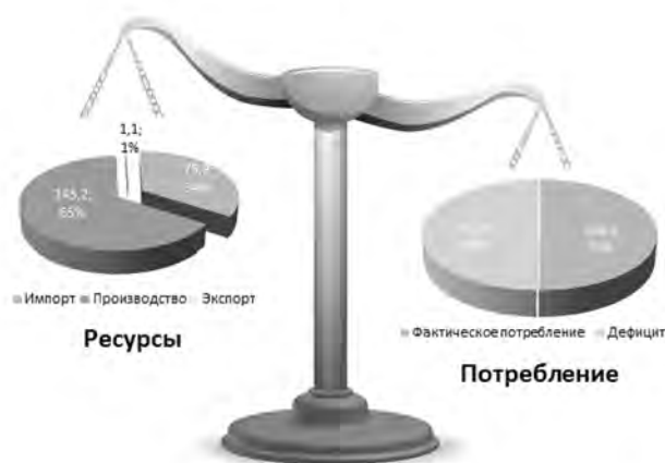
Рис. 3. Баланс ресурсов и потребления овощей в Иркутской области в 2017 году, тыс. т. Fig. 3. Balance of resources and consumption of vegetables in the Irkutsk region in 2017, thousand tons.

Объемы экспорта и импорта овощей в Иркутской области представлены на рисунке 2.