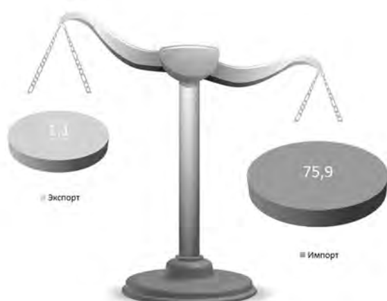
Рис. 2. Объемы экспорта и импорта овощей в Иркутской области в 2017 году, тыс. т. Fig. 2. Volumes of export and import of vegetables in the Irkutsk region in 2017, thousand tons.

щей населением Иркутской области составил в 2017 году 169,4 тыс. т, что на 18% ниже аналогичного показателя за предшествующий год.