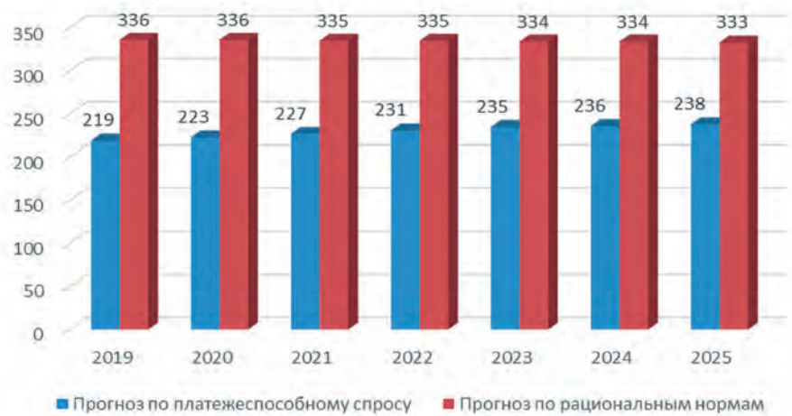
Рис. 4. Прогноз потребности в овощах для населения Иркутской области на 2019-2025 годы, тыс. т. Fig. 4. Forecast of demand for vegetables for the population of the Irkutsk region for 2019-2025, thousand tons.

Потребность в овощах для населения Иркутской области в 2019-2021 годах составляет в среднем 223,00 тыс. т, исходя из объема платежеспо-