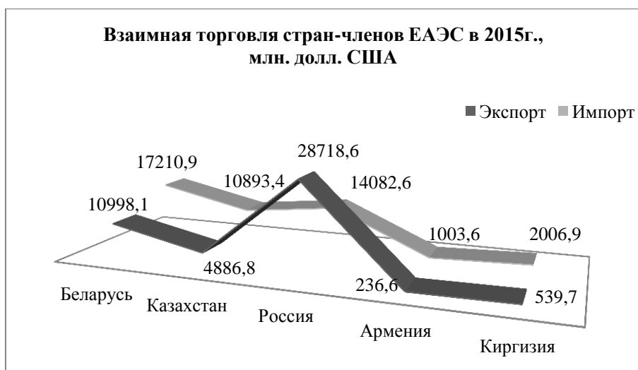
Рисунок 1 – Взаимная торговля стран-членов ЕАЭС в 2015 г., млн. долл. США Примечание – Разработка авторов на основе [8].