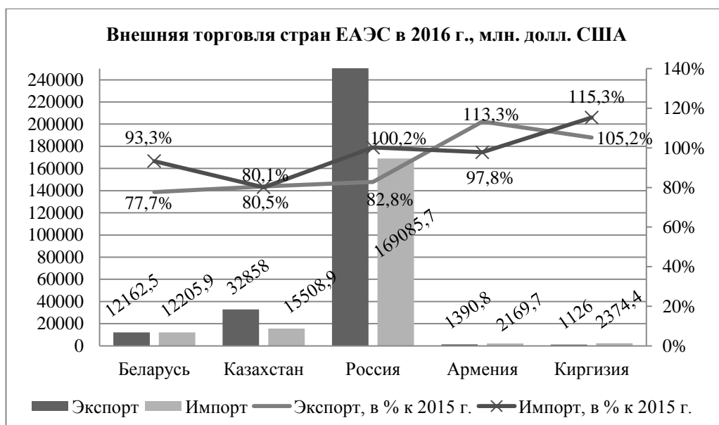
Рисунок 4 – Внешняя торговля стран ЕАЭС в 2016 г., млн. долл. США

Примечание – Разработка авторов на основе [8].