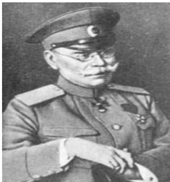
Генерал М.В. Аляксееў

У той жа час начальнікам штаба расійскага галоўнакамандавання М.В.Аляксеевым і галоўнакамандуючым Заходнім фронтам А.Е.Эвертам прымаліся ўсе неабходныя меры, якія на іх думку маглі паспрыяць дысцыпліне сярод салдат і абмежаваць доступ інфармацыі аб дэталях новага наступлення для праціўніка. Так падчас аперацыі выдаецца загад Эверта «Па барацьбе з п'янствам», дзе забараняецца ўсялякі продаж, набыццё і распіццё спіртных напіткаў [4]. А затым на падставе «Правіл аб мясцовасцях, аб'яўленых на ваенным становішчы» былі праведзены во-быскі сярод прыфрантавога насельніцтва, а таксама арганізаваны прагляд пісьмаў, запісаў салдат і г.д. [5].