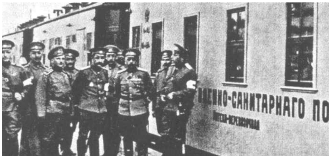
Ваенна-санітарны поезд у Баранавічах

У выніку 9-я армія Войрша ў складзе 7 нямецкіх і 2 аўстрыйскіх дывізіі займала фронт агульнай працягласцю 163 км. Умацаваная абарончая паласа гэтай арміі ў раёне Баранавічы – Цырын, дзе верагоднасць расійскага наступлення была найбольшай, уключала 3 лініі акупаў з інтэрвалам у 5 км. Акопы былі абсталяваны траверсамі, казыркамі, 613 пляцоўкамі для кулямэтаў, мелася болей за 400 гармат. Яшчэ 80 гармат з мэтай манеўравання і дастаўкі іх на самы патрэбны ўчастак фронту знаходзіліся напачатку на падводах у рэзерве.