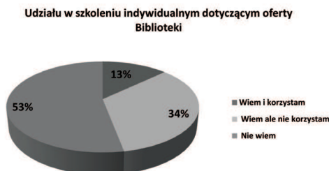
Ryc. 2. Znajomość oferty szkoleniowej dla indywidualnych czytelników.

Analizując kolejne pytanie, zauważono, że duży odsetek (53%) ankietowanych nie zdaje sobie sprawy z możliwości uczestniczenia w szkoleniu indywidualnym dotyczącym oferty biblioteki. Taki wynik wskazuje na potrzebę ciągłego informowania oraz wprowadzenia nowych sposobów na docieranie do użytkowników. Zastanawiające jest także to, że jedynie 13% badanych korzystało z indywidualnego przeszkolenia, co sugeruje konieczność większego otwarcia się bibliotekarzy na przychodzącego czytelnika (ryc. 2).