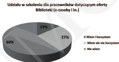
Ryc. 3. Znajomość oferty szkoleniowej dla pracowników.

Oferta Biblioteki Głównej UP w zakresie prowadzenia szkoleń dla pracowników uczelni jest znana mniej niż połowie ankietowanych (40%). Jednak z całej grupy badanych aż 158 zaznaczyło, że nie korzysta z tej oferty szkoleń (ryc. 3). Zachowanie to można tłumaczyć nieznaną ofertą biblioteki bądź własnymi umiejętnościami informacyjnymi użytkowników bibliotek uniwersyteckich. Użytkownicy sprawnie posługujący się informacjami w sieci mogą nie być zainteresowani tą usługą biblioteki. Jednak jak wynika z doświadczenia pracy z użytkownikiem poszukującym informacji naukowej, brak zainteresowania zdobywaniem szerszych umiejętności korzystania z zasobów biblioteki wpływa na wykorzystanie zaledwie ich części.