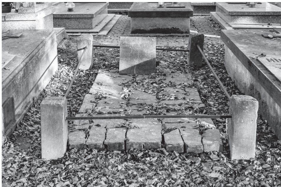
3. Grób Kazimierza Juszczakowskiego przy ul. Lipowej, 2017 r.

Z perspektywy odległego czasu trudno szczegółowo odtworzyć życiorys Kazimierza Juszczakowskiego. Na podstawie zachowanych dokumentów można