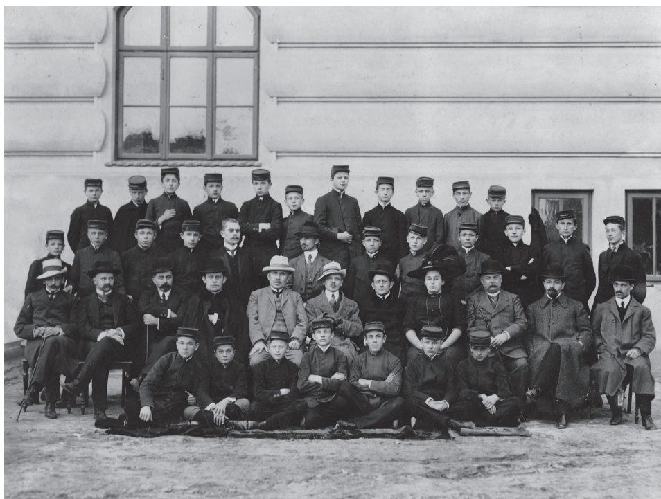
5. Nauczyciele i uczniowie Szkoły Lubelskiej, rok szkolny 1914/1915 [?]