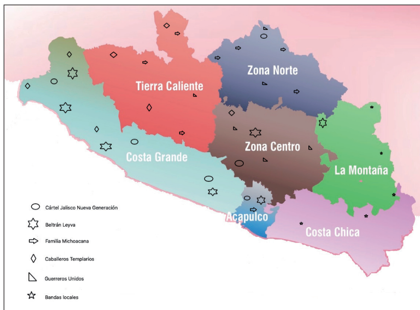
Mapa 1. Grupos del crimen organizado en Guerrero (octubre 2014)