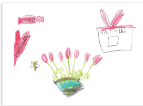
Rys. 3. Prezenty wręczone z miłości

Dziewczynki ze szkół tradycyjnych na swoich rysunkach najczęściej miłość przedstawiały jako sytuację wręczania prezentów, przestrzeń wypełnioną miłością. W ich wytworach plastycznych pojawiły się też dwie osoby trzymające się za ręce, nad którymi znajduje się bardzo duże serce, będące wyrazem łączącego je uczucia (rys. 4).