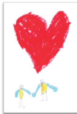
Rys. 4. Osoby trzymające się za ręce oraz serce

Natomiast na rysunkach chłopców najczęściej pojawiały się prezenty, jakimi można obdarować ukochanego/ukochaną (rys. 3), a także sama sytuacja wręczania prezentu drugiej osobie. Szczegółowe dane zawiera tab. 5.