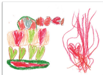
Rys. 2. Czołg zbudowany z serc

Wśród chłopców, oprócz symboli rozpowszechnionych w społeczeństwie, dominował dodatkowo motyw czołgów lub innych środków transportu zbudowanych z serc lub nimi strzelających (rys. 2). Na ich rysunkach pojawiły się także wszelkiego rodzaju postaci z bajek, roboty rozpowszechniające miłość na świecie za pomocą różnego rodzaju broni. Szczegółowe dane zawiera tab. 4.