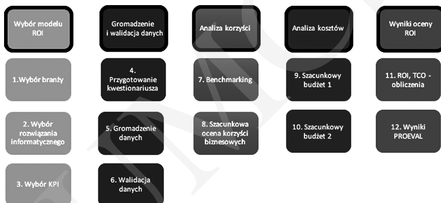
Rys. 3. Szczegółowy proces oceny PROEVAL