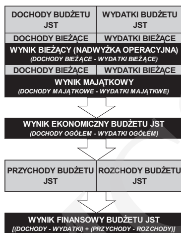
Rys. 1. Elementy równoważenia budżetu JST