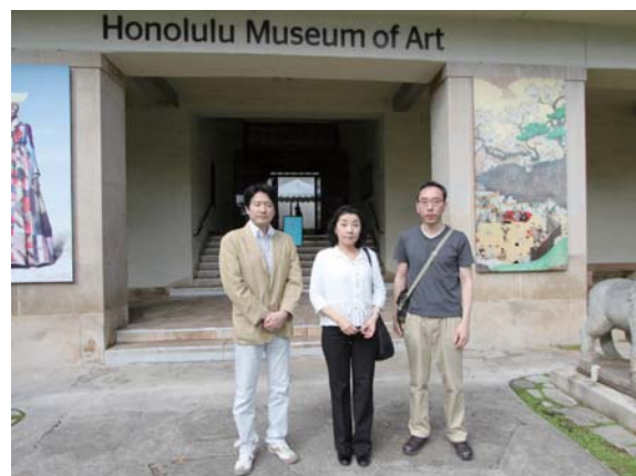
ホノルル美術館正面玄関にて