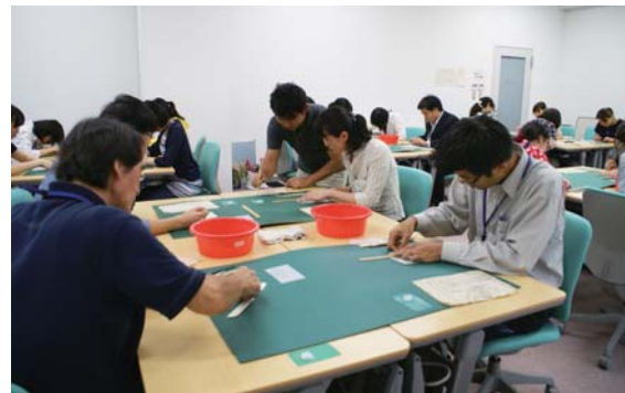
文書修復の実習風景