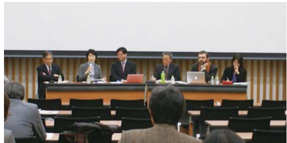
シンポジウム「もう一つの室町」