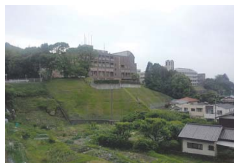
筑紫女学園大学外観

史料編纂所での 2 年半の任期が終わり、本年の 4 月から現職に就きました。公募への応募で得た職で、専任の准教授ですが任期がついています。単身赴任で週末に東京に戻る生活をしています。授業は 1 年生のものから 4 年生の卒論まで、教職課程もふくめてまんべんなく担当しています。素直でまじめな学生が多く、やりがいを感じています。毎日毎日授業準備と小テストやレポートの採点に追われながら、オープンキャンパスや入試説明会、高校への「出前授業」などの仕事もあり、忙しいです。そのほかに論文執筆や調査などの時間も見つけなくてはなりません。まだサイクルに慣れきっていないこともあり、バタバタすることも多いです。前期を終え、自分なりに反省もしながら、後期の授業を一層充実させていきたいと考えています。