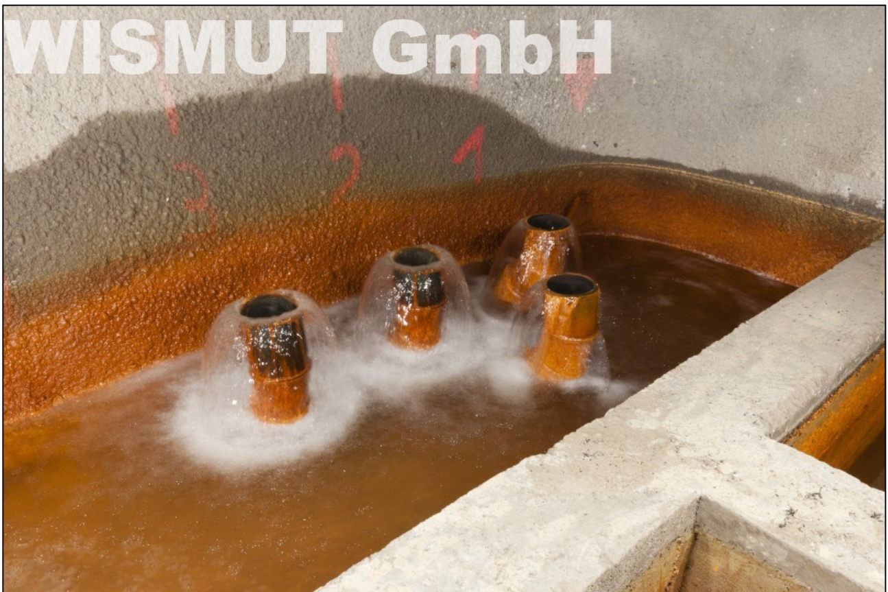
Abb. 3: Austritte von Grubenwasser aus vier Bohrungen am östlichen Endpunkt des Wismut-Stollns.

Der Versuch des natürlichen Einstaus war demnach nicht zu realisieren. Die Wismut GmbH griff angesichts der gesammelten Erfahrungen auf eine frühere Planungsvariante, auch Backup-Option genannt, zurück. Diese sah die Auffahrung eines Verbindungsgrubenbaues, des sogenannten Wismut-Stollns, im Niveau von rd. +120 m NHN vor. Der Wismut-Stolln verbindet den Tiefen Elbstolln mit dem Grubengebäude im Bereich Gittersee östlich der Weißeritz und schafft die benötigte Wasserwegsamkeit zur sicheren und nachhaltigen Ableitung der Grubenwässer an den Tiefen Elbstolln und damit an die Elbe.