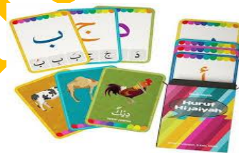
Gambar flash card

menemukan, memanfaatkan dan mengambil kesimpulan. Bermain juga dapat mengembangkan psiko-motorik anak. misalnya dalam pembelajaran bahasa Arab dapat dilakukan dengan permainan seperti tema kebersihan. Anak anak dapat bermain balok dengan menyusun huruf hijayah, fuzzel dengan menyusun dan menyebutkan huruf atau angka hijayah, flash card dengan memperkenalkan huruf hijayah ini akan mengembangkan kecerdasan pada anak.