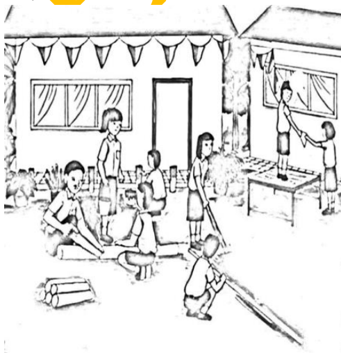
التَّعَاوُن - Kerjasama

Contoh media gambar dengan tema “kerjasama”