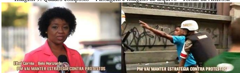
Imagem 9: Quadro composto – Passagem e imagens de arquivo – Jornal da Alterosa

A atuação da polícia como actante-agente da narrativa, responsável por prisões em flagrante e evitando a depredação de patrimônio, evidencia mais uma vez o reforço do imaginário de crença dos policiais como profissionais eficientes, heróis do dia a dia. Esse imaginário positivo em relação à polícia, e negativo em relação aos manifestantes, ganha ainda mais força na composição de vozes opinativas de pessoas aleatórias no final da reportagem: “A atitude preventiva é a melhor opção, né?”; “Achei perfeitamente correto.