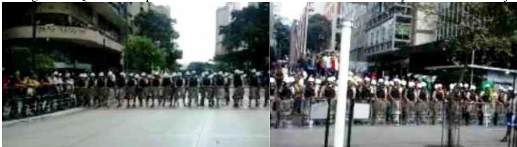
Imagem 12: Quadro Composto - Barreiras da PM nos cruzamentos da Praça Sete – Mídia Ninja

A força bélica em grande quantitativo é contrastada pelo número ínfimo de manifestantes registrados, portando tão somente um megafone, além de bandeiras, cartazes e uma bola. A lúdica e inofensiva partida de futebol é registrada pelo Ninja, demonstrando a contradição frente ao cerco policial.