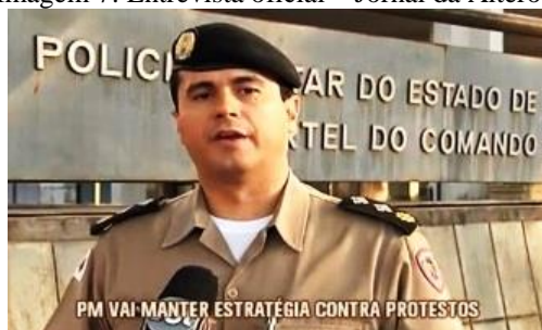
Imagem 7: Entrevista oficial – Jornal da Alterosa

Nesse momento, a reportagem traz imagens arquivo das manifestações do ano anterior, usadas de modo simbólico-metafórico, fazendo imergir um imaginário negativo dos manifestantes. São enquadramentos que mostram depredações e explosões, quase como um cenário de guerra.