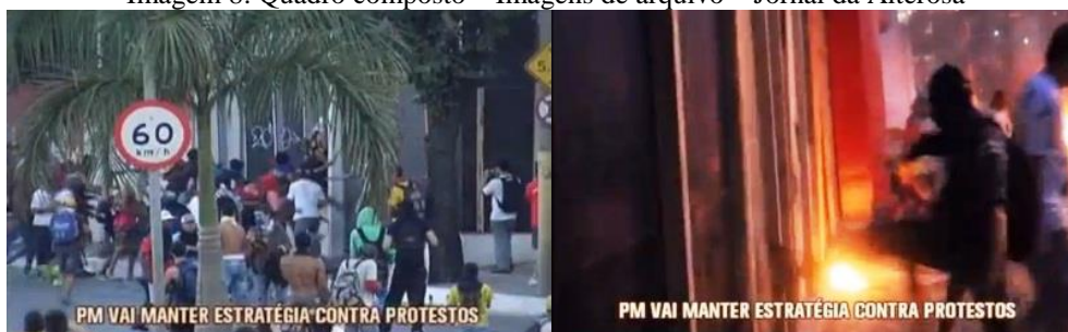
Imagem 8: Quadro composto – Imagens de arquivo – Jornal da Alterosa

Nesse momento, a reportagem traz imagens arquivo das manifestações do ano anterior, usadas de modo simbólico-metafórico, fazendo imergir um imaginário negativo dos manifestantes. São enquadramentos que mostram depredações e explosões, quase como um cenário de guerra.