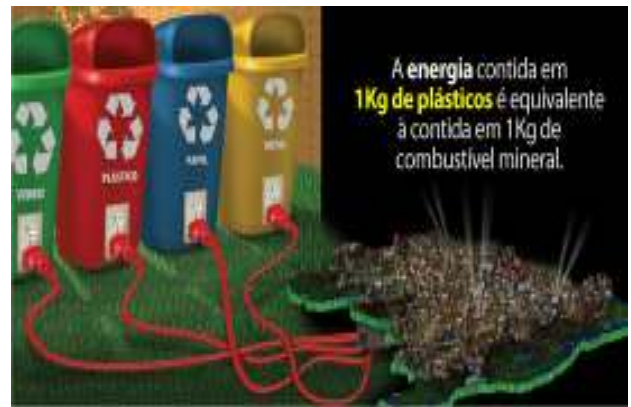
Figura 2: A Energia Proveniente do Plástico

Abaixo, na Figura 2, é relatada a quantidade de energia do plástico, ressaltando o seu grande poder calorífico.