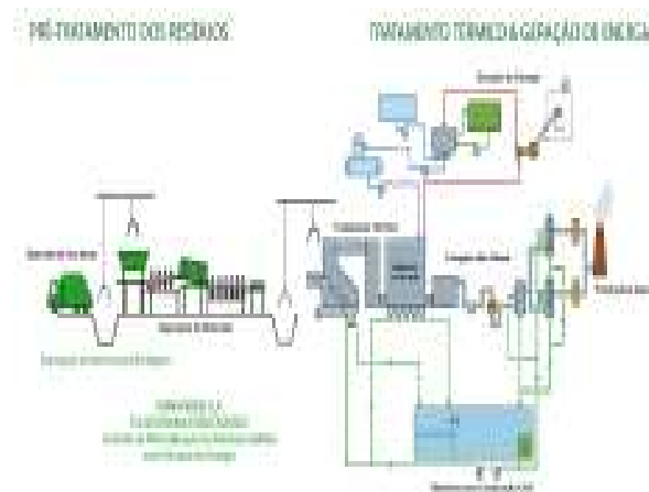
Figura 3: Processo da Reciclagem Energética/ USINA VERDE

O funcionamento da Usina Verde está representado pelo fluxograma abaixo: