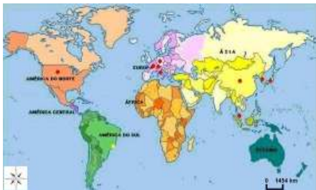
Figura. 1: Mapa dos Países com Reciclagem Energética