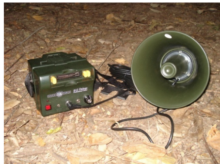
Figura 1 – Indivíduo ( Cebus nigritus ) do grupo de estudo utilizado como modelo. Figura 2 - Equipamento de play-back utilizado no estudo.