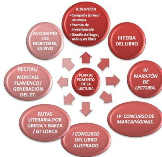
Gráfico V. Actividades complementarias y extraescolares