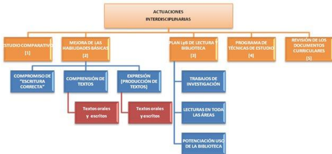
Grafico 11. Actuaciones interdisciplinarias