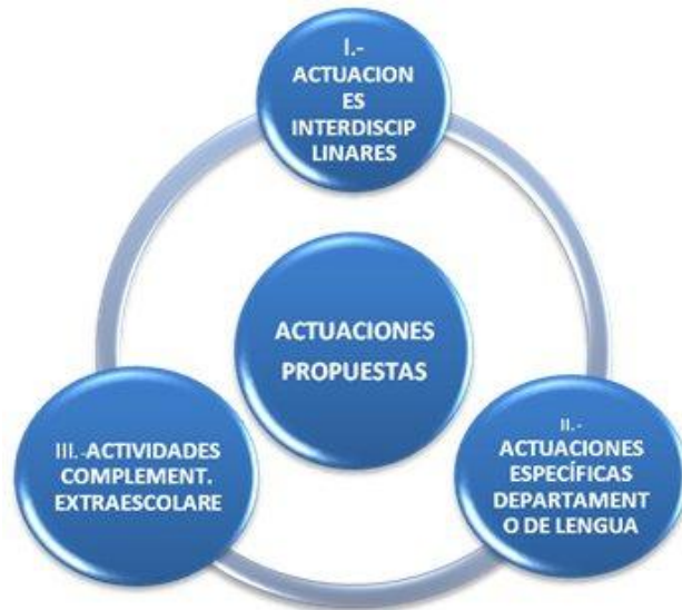
Grafico 1. Actuaciones de mejora propuestas