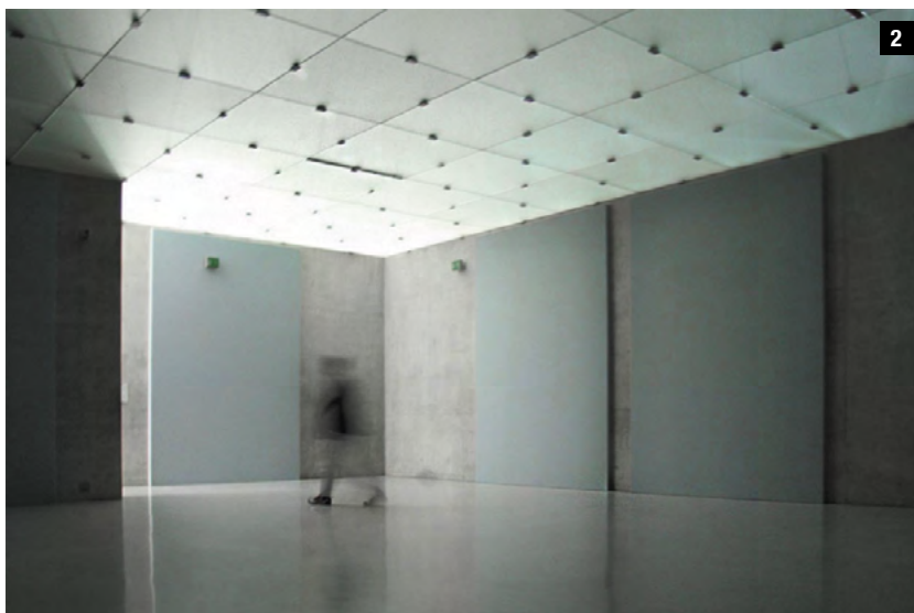
2 © C. CAUWERTS J. KESSLER - 2009

Un bagage génétique et culturel partagé ainsi qu'une expertise personnelle permettent à l'architecte de défendre l'hypothèse qu'il est possible d'anticiper la dimension atmosphérique d'un espace, entre autres grâce à un travail par l'image. Mais en architecture, le passage à la réalité tridimensionnelle semble inévitable. D'après Wigley 2 , "atmosphere seems to start precisely where construction stops". Et c'est dans la rencontre instantanée de l'occupant avec l'architecture que naît, ou non, l'atmosphère du lieu. Sa représentation par l'image ne pourra jamais qu'approcher, rappeler ou suggérer cette expérience.