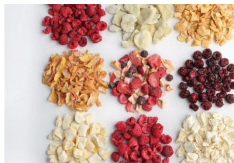
Gambar 1. Produk Freeze Drying

Menurut SNI 01-4269-1996 Keripik buah merupakan makanan yang dibuat dari daging buah yang di masak, dipotong/disayat kemudian digoreng memakai minyak secara vakum dengan atau tanpa penambahan gula serta bahan tambahan makanan yang diijinkan [7]. Berbeda dengan definisi SNI tersebut, Keripik buah dengan metode freeze drying dibuat dengan metode yang berbeda [6].