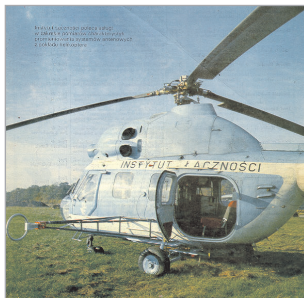
Rys. 2. Wielozadaniowe laboratorium kontrolno-pomiarowe na śmigłowcu

W latach siedemdziesiątych w Zakładzie Kompatybilności Elektromagnetycznej Instytutu Łączności zostało utworzone wielozadaniowe laboratorium kontrolno-pomiarowe na śmigłowcu (rys. 2). Było ono wykorzystywane w różnych celach, m.in. do szybkiego wykrywania źródeł promieniowania radiowego, powodujących zakłócenia, a także do kontroli emisji radiowych.