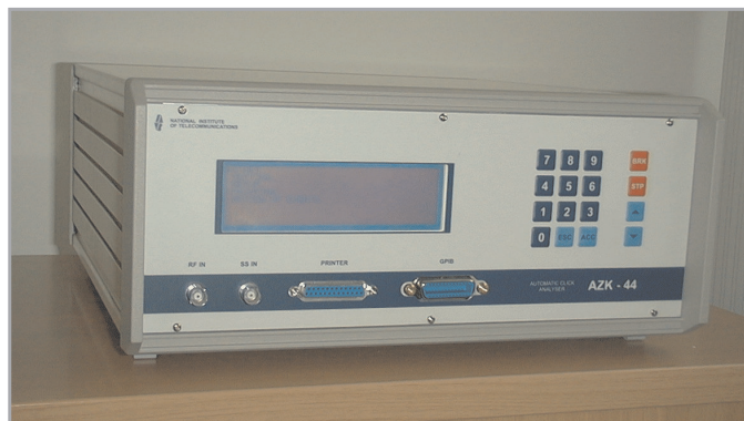
Rys. 1. 4-kanalowy analizator AZK-44

Innym urządzeniem, uznanym na międzynarodowych rynkach aparatury pomiarowej, był analizator zakłóceń impulsowych krótkotrwałych (rys. 1), również produkowany seryjnie w ZPAE INCO oraz prezentowany na wystawach międzynarodowych w Londynie i Brukseli.