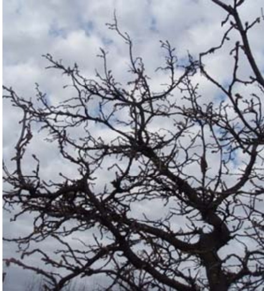
Figura 2. Ausencia de poda en avellano, con crecimientos anuales muy reducidos. Caso 4.