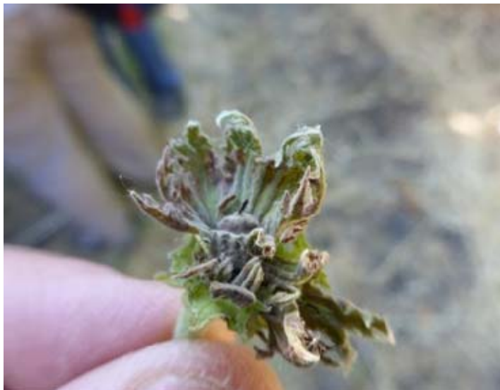
Figura 1: Daño causado por heladas tardías en avellanos del VIRN

2- Estudio de casos: Análisis de factores varietales y culturales que pudieran incidir sobre la producción media de avellanos del VIRN.