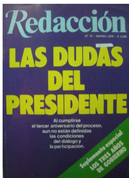
Tapa de Redacción de marzo de 1979, al cumplirse el tercer aniversario del inicio de la dictadura

Redacción , como lo venía haciendo desde el golpe de 1976, presentaba a Videla como una suerte de “garante” de la democracia futura, que parecía tener que lidiar con los sectores internos de las FF.AA que no estaban interesados en prontas salidas u aperturas políticas. Pero también lo ubicaba en una posición ambigua, ya que pese a sus declaraciones de “fe democrática” lo que persistían eran las dudas en relación a una convocatoria concreta a los dirigentes políticos. Esas dudas demostrarían tener su asidero: hacia 1979 Videla se había quedado “sin juego propio” en casi todos los ámbitos de poder, y el apoyo a Martínez de Hoz se tornó su proyecto exclusivo y el único que le podría proveer mayor sustentabilidad (Novaro y Palermo 2003). En efecto, contrariando las resistencias de un variado arco opositor, que incluía a empresarios ligados al mercado interno y al agro, sectores de las FF.AA, los sindicatos, los partidos tradicionales y la Iglesia, entre otros, en diciembre de 1978 el ministro de Economía profundizará la apertura comercial y la liberación del mercado de capitales que se venía aplicando desde 1977.