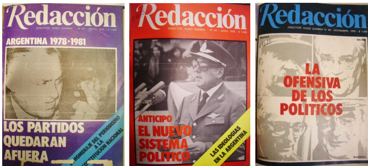
La cuestión de los partidos y el futuro del sistema político, preocupación excluyente en Redacción durante 1978 (tapas de mayo, junio y noviembre de 1978)

que pretendían las FF.AA. Evidentemente en esa nueva etapa Redacción , desde su posición enunciativa como revista líder de opinión, había decidido influir para que el gobierno concretara una mayor apertura hacia los civiles visibilizando las “voces políticas” del momento. Dentro de esta orientación editorial, la revista publicó varias entrevistas a dirigentes políticos, civiles y a militares sobre distintos aspectos de la realidad nacional 18 .