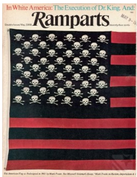
Tapa de la revista Ramparts , que inspiró el logo de Redacción