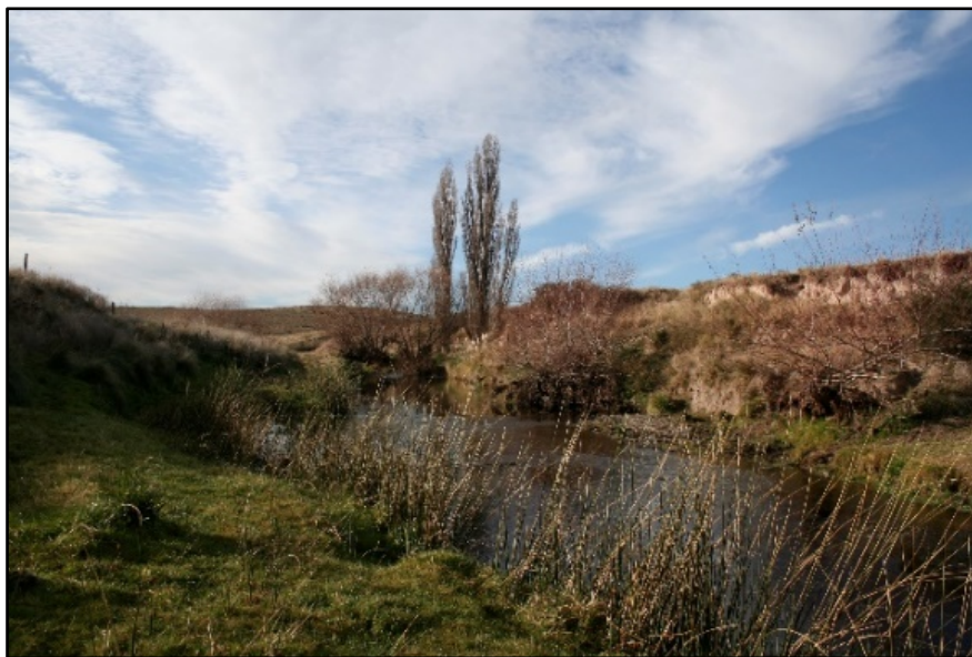
Figura 4. Canal principal arroyo El Negro.

En el tramo analizado el canal de estiaje tiene un ancho promedio de 9,60 m y una profundidad de 40 cm en el sector central. La velocidad promedio de la corriente es 1,03 m/s y presenta un flujo de agua de tipo uniforme sin controles observables de fondo o de las riberas. Los sedimentos del fondo están compuestos principalmente por bloques (>84 mm), gravas gruesas (4-64 mm) y arenas (0,05- 2 mm) (Fig. 4). En las barras laterales y centrales predomina la arena sobre las demás granulometrías.