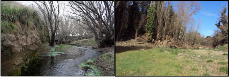
Figura 5. Estado de las especies arbóreas al pie de ambas terrazas.

La terraza derecha está compuesta por material cohesivo en casi toda su extensión siendo los sedimentos más abundantes, el limo y la arcilla. El proceso erosivo no es significativo en épocas de estiaje, activándose durante las crecidas. La barranca no es estable, si bien no se observan agrietamiento de los materiales, sí existen desprendimientos provocados por la erosión del arroyo. La vegetación está caracterizada por especies Populus alba y Salix spp , cuyos ejemplares más añejos son de más de 25 m de altura.