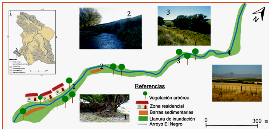
Figura 2. Perfil en planta del tramo seleccionado.

En este apartado se describen las características morfológicas del tramo del arroyo El Negro siguiendo la metodología de Thorne (1998) para luego realizar la tipificación. En la Figura 2 se puede observar el perfil en planta del tramo, el cual fue seleccionado por ser el lugar donde los cambios morfológicos son más visibles y por encontrarse próximo al área urbanizada. Estos cambios se producen principalmente durante las crecidas y generan barras sedimentarias y diques formados por restos de vegetación.