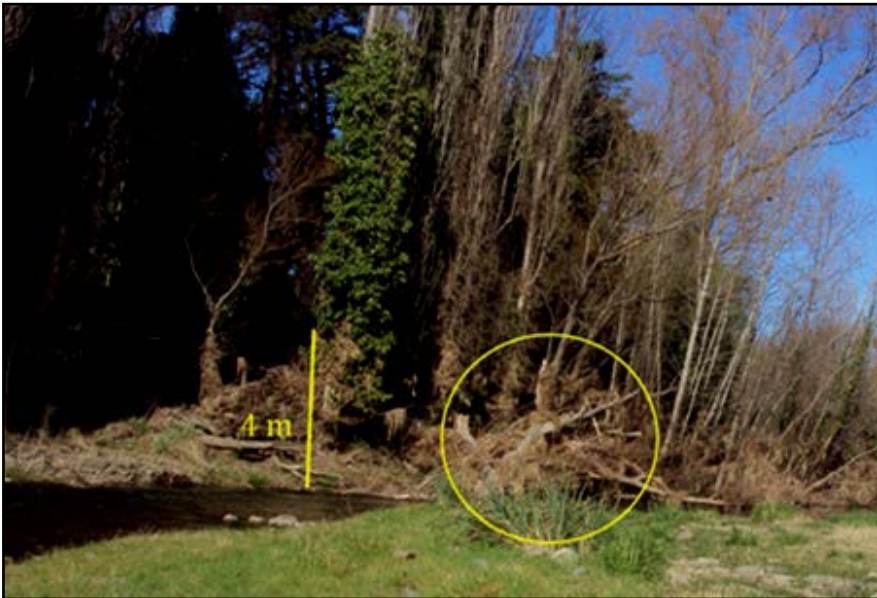
Figura 3. Restos vegetales indicadores de crecidas.

La llanura de inundación es asimétrica, presenta un ancho de 100 m y tiene mayor desarrollo sobre la margen derecha. La margen izquierda tiene terrazas que están constituidas mayormente por depósitos de loess (sedimento de origen eólico, a partir del cual se desarrollan los suelos de la región). En algunos sectores de la llanura de inundación se encuentran especies arbóreas ( Populus alba ) y herbáceas del pastizal pampeano de forma fragmentada. Estas especies permiten estimar la altura máxima del arroyo durante las crecidas. A modo de ejemplo en la Figura 3 se puede observar la evidencia de la última gran crecida de marzo de 2015 en la cual el agua superó los 4 m. La relación entre el canal y la llanura de inundación es de naturaleza dinámica. En el tramo analizado las terrazas presentan una altura aproximada de 5 m, hallándose cubiertas por vegetación. Los depósitos que las componen son arenas gruesas (>1 mm), finas (>0,125 mm) y clastos del tipo bloques (>64 mm). También existe una relación lateral entre el canal y la llanura de inundación, la cual se observa en la forma en planta, en este tramo presenta una sinuosidad baja ( S=1,1 ) considerado “rectilíneo” según la clasificación de Rust (1978).