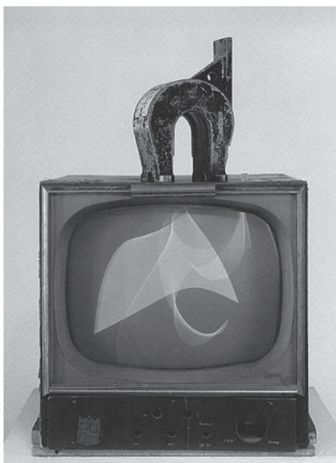
Fig. 8: Nam June Paik - Magnet TV , 1965.

También, Paik hace uso del silencio en numerosos trabajos, como en TV Clock de 1963, donde se observan 24 televisiones manipuladas a color. A la vez que se siente el silencio, nuevamente entrecortado por las propias circunstancias momentáneas del espectador se muestran unas líneas semejantes a saetas de reloj. De acuerdo, a John G. Hanhardt, esta obra “trata del tiempo a la manera de una serie de momentos discretos en monitores individuales que comprimen la imagen de video en una línea horizontal. La secuencia de 24 monitores en TV Clock representaba el movimiento del tiempo a través del espacio de la instalación como momentos estáticos discretos.” (Hanhardt, 2000: 103).