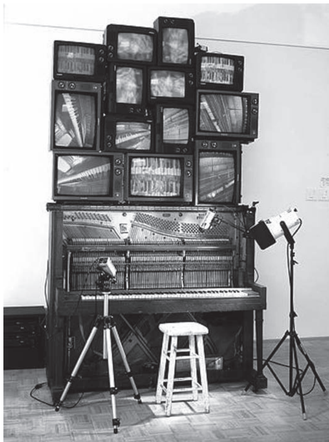
Fig. 12: Nam June Paik - Piano Piece , 1992.

Un año después del fallecimiento de Cage en 1992, Paik hizo en su honor Piano Piece , donde se da una disposición inusual de objetos, con 13 monitores, videocámaras montadas en trípodes y un piano, entre otros objetos. En este trabajo cuidadosamente orquestado, un programa informático, realizado por Richard Titlebaum, reproduce la música de Cage sobre el piano, apareciendo la imagen del compositor en cuatro monitores centrales en la parte superior. Alternándose con las manos y la cabeza de Paik, están las imágenes de su amigo Cage y del coreógrafo Merce Cunningham, con imágenes de bebés aparentemente sin relación. Este empleo inusual del piano resulta apropiado como homenaje a Cage, cuyos experimentos se realizaron con pianos alterados y preparados.