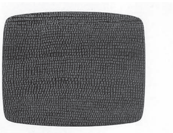
Fig. 11: Nam June Paik - I-Ching/Et-Ching , 1984.