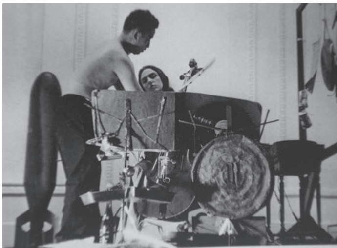
Fig. 6: Paik y Charlotte Moorman realizando la versión de John Cage "26'1.1499", 1964.

Charlotte Moorman sería una fuente de inspiración y apoyo, participando de forma activa en algunas de sus principales obras en vídeo. Por ejemplo, destaca Ópera Sextronique de 1967, donde se realiza un striptease musical en el que Moorman según tocaba el violonchelo se iba desnudando, lo que provocó el arresto de ambos. Por ejemplo, en TV Bra for living sculpture de 1970, el instrumento electrónico se convierte en pieza de vestir para el cuerpo humano de Charlotte Moorman. La propuesta se compone de dos tubos de rayos catódicos que la violonchelista lleva como sujetador. Al emplear la televisión como un sujetador, una de las prendas más íntimas del ser humano, intenta humanizar la electrónica y la tecnología.