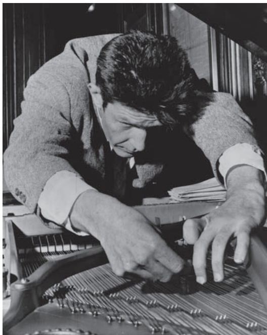
Fig. 1: John Cage - Variations VII, 1966.