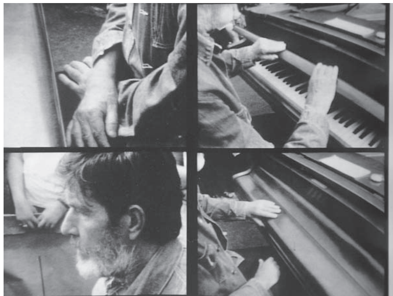
Fig. 5: Nam June Paik - A Tribute to John Cage , 1959.