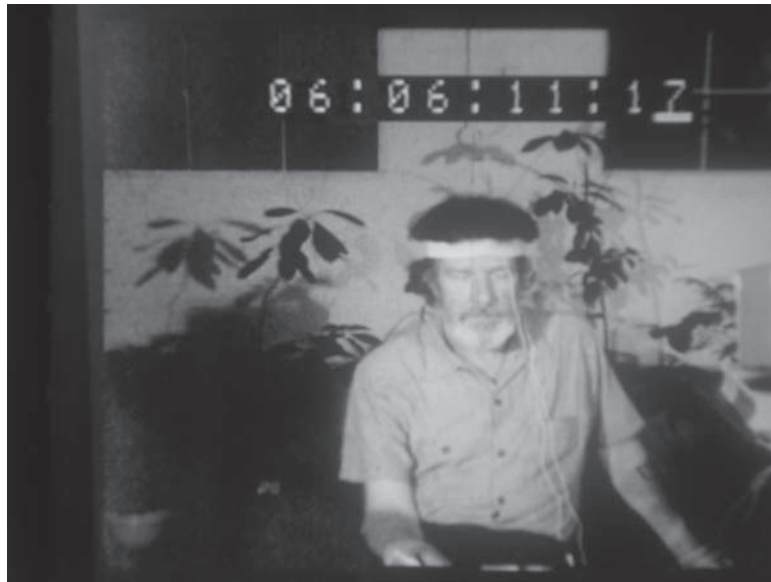
Fig. 4: Nam June Paik - A Tribute to John Cage , 1959.

y el uso de pletinas para transformar su contenido, a su vez comenzará a alterar la imagen recibida y previamente grabada.