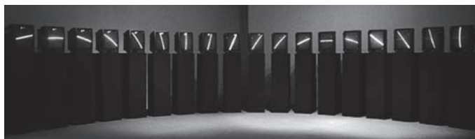
Fig. 7: Nam June Paik - TV Clock , 1963.

Cage niega la existencia del silencio, no rechaza el concepto de la nada o el vacío entre los sonidos que hace que no se obstruyan entre sí. El silencio ha sido una de las facetas relacionadas por John Cage con la vacuidad del budismo zen.