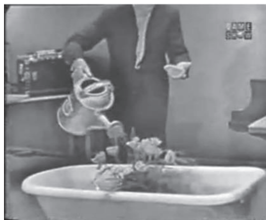
Fig. 10: John Cage en un Happening, 1952.

Por otra parte, Cage fue uno de los iniciadores del “Happening” cuando en 1952 realiza un evento en Black Mountain College, con una serie de actividades desconectadas unas de otras, al encontrarse una persona bailando, otra tocando el piano, otra recitando, etc. En esta primera propuesta, queda clara su intención de involucrar al espectador a través de su filosofía de la “no intención”, es decir, lo que sucede está abandonado al azar, no pretendiéndose comunicar algo determinado.