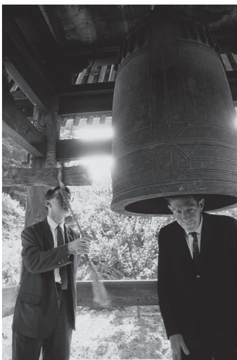
Fig. 2: John Cage y David Tudor en Japón, 1960.

Cage empezó a adentrarse en el pensamiento de las filosofías orientales y especialmente buscó el sentido de lo que era una “mente serena” y las “influencias divinas”. También, resultó relevante la lectura del místico cristiano medieval Maestro Eckhart, así como el descubrimiento del taoísmo y del budismo zen al ser oyente asiduo de Daisetz Teitaro Suzuki (*1870; †1966) 5 , en la Universidad de Columbia, imprimiendo a partir de aquí todo su pensamiento, convirtiéndose, de hecho, para Umberto Eco en “el más inopinado maestro zen” (Barber, 1985: 26). Destaca por ejemplo la conferencia “Indeterminación, nuevo aspecto formal en la música instrumental y electrónica”, de 1958, redactada por Cage como una colección de anécdotas al estilo zen, que lee al público a ritmo de una por minuto.