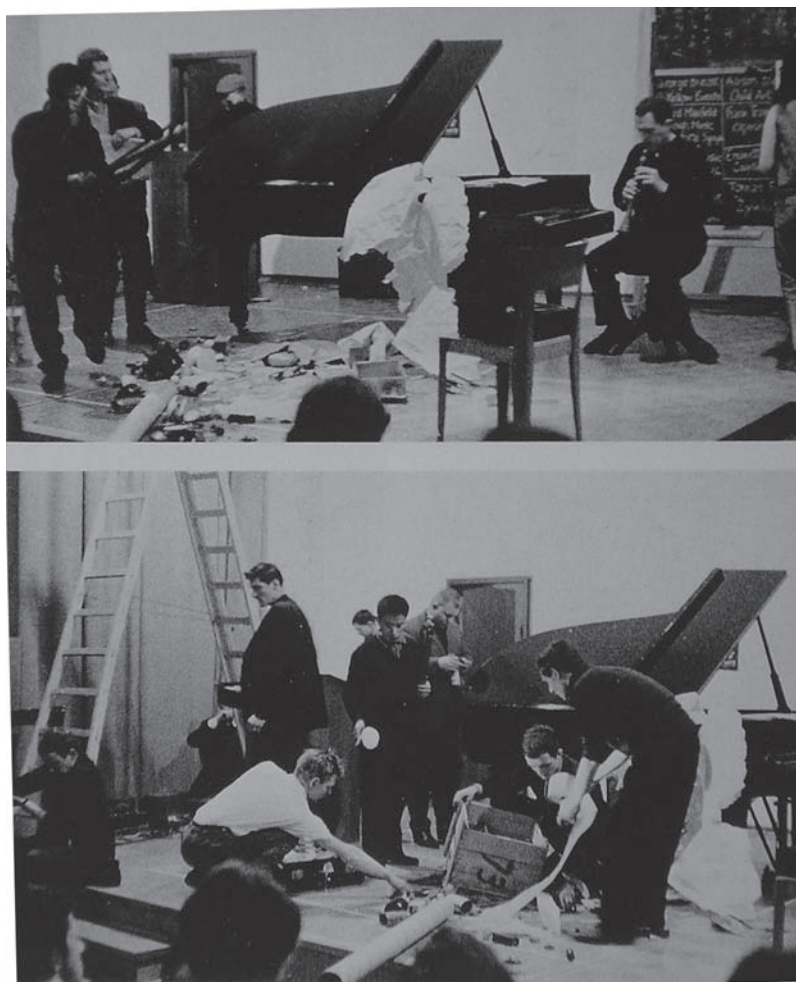
Fig. 9: Nam June Paik – Festum Fluxorum , 1963.

Algunas de sus obras relacionadas con la filosofía de Cage han sido A Tribute to John Cage , de 1959, donde más allá de las acciones patentes, incluye juguetes, cajas de hojalata llenas de piedras, huevos, cristales rotos, una gallina viva y una motocicleta. En Estudio para pianoforte de 1960, Nam June Paik baja al escenario, corta la corbata de Cage con unas tijeras y pring a éste y al compositor David Tudor con espuma de afeitar, una acción que recuerda Cut Piece , de 1964, donde Yoko Ono se sienta en un escenario, invitando a los espectadores a que le corten la ropa. Paik, en la época de Fluxus, solía realizar acciones improvisadas, donde se subvierten los protocolos escénicos tradicionales y se fomenta la anarquía a través de gestos concretos, como Festum Fluxorum , de 1963.