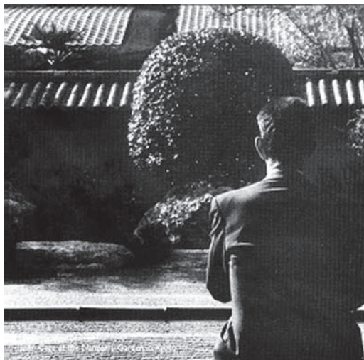
Fig. 3: John Cage meditando en un jardín zen, 1960.

Cage, un alumno de Arnold Schoenberg y amigo de Robert Rauschenberg 6 y Pierre Boulez, fue desde el comienzo de su carrera musical un dinamizador de la estructura como de la forma compositiva, en base a medios electrónicos, el uso de los procesos del azar, la notación gráfica, elementos tímbricos, que incluían el ruido accidental y uso de elementos extramusicales como generadores de sonido. En relación a esto último, Cage utiliza el concepto Duchampiano de “obra abierta”, lo que significa que el creador debe permitir que todo tipo de acontecimientos externos a la obra interfieran con la propia composición. Para su recreación, hace uso del azar, siendo realizada toda la obra de manera aleatoria, sin la alteración del artista mediante su opinión personal. Para ello, propone de manera directa eliminar la expresividad de la obra, aniquilando la presencia del ego personal 7 , permitiendo que las emociones hacia la obra provengan del exterior, de los propios espectadores. Este aspecto de la música como proceso va a tener su origen en el rechazo de la música tonal.