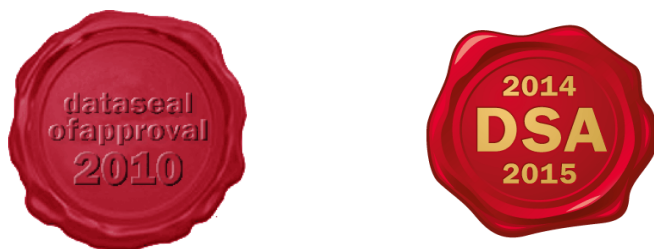
Figura 2. I "sigilli" rilasciati sulla base della prima (a sinistra) e della seconda (a destra) versione delle DSA Guidelines

questa valutazione, se l'esito è favorevole, viene rilasciato il "Data Seal of Approval", ovvero il "sigillo di approvazione dei dati" il cui logo potrà essere pubblicato nella home-page del sito web del deposito (si veda la Figura 2); l'auto-valutazione verrà poi pubblicata sul sito del Data Seal of Approval . Ovviamente il sigillo di approvazione viene rilasciato sulla base di una particolare versione delle linee guida e potrà essere utilizzato sul sito web del deposito a tempo indeterminato. Tuttavia, se il deposito vuole mantenere aggiornata la sua certificazione, dovrà nel tempo sottoporsi nuovamente ad ulteriori procedure di auto-valutazione 12 sulla base delle nuove versioni del Data Seal of Approval che saranno via via rilasciate (ricevendo i relativi "sigilli" se l'esito sarà favorevole) 13 .