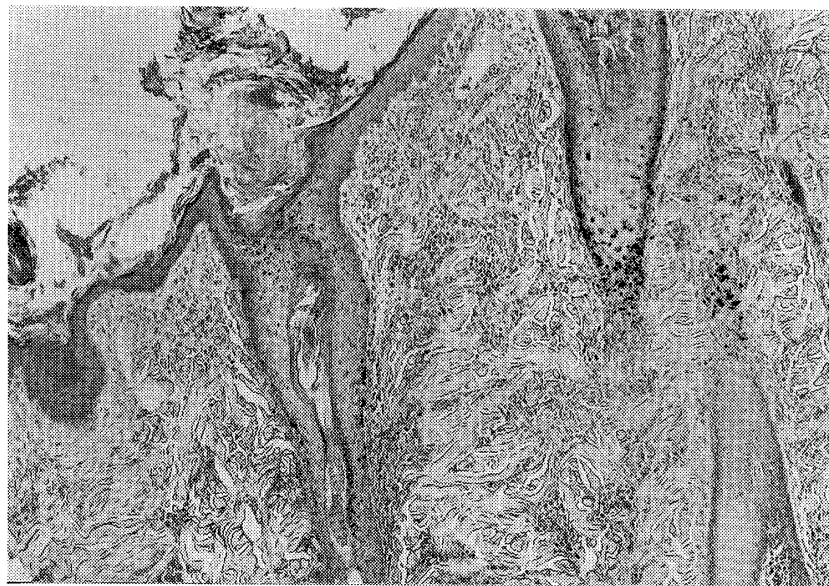
図4 送信した顕微鏡画像 (カラー映像)

各演題において発表者はまずその症例の臨床症状を述べ、次いで解剖所見、顕微鏡所見について説明した。最後にその病気の診断名を述べ、その根拠を説明した。実際に送信したテロップおよび顕微鏡写真の例を図3と4に示す。引き続き各大学の司会者により質問や意見を受け付け討論を行い、両大学合意の診断名を付けてまとめた。