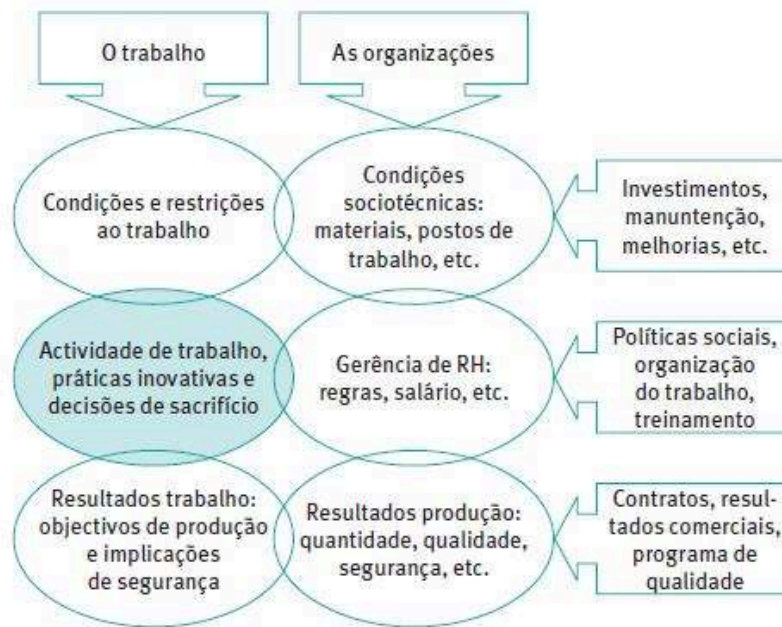
Figura 1: As diversas dimensões da análise