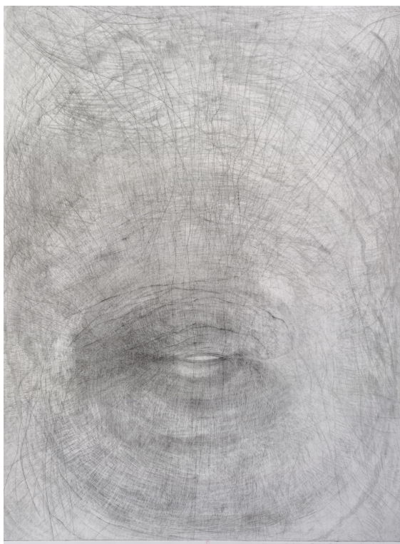
Ill. 7. Marie Belorgey. Grand Gris VII , pointe sèche, grattoir et brunissoir 2014, 76,1 x 55,8 cm. BnF, Estampes, Dz-558-Boîte FT5