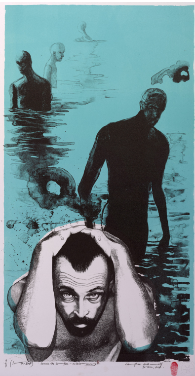
III. 5. Christiaan Diedericks, Beneath the surface: Cellular memory II , impr. Atelier le Grand Village, lithographie, 2014, 85 x 50,2 cm. BnF, Estampes Dz-599-Boîte FT5