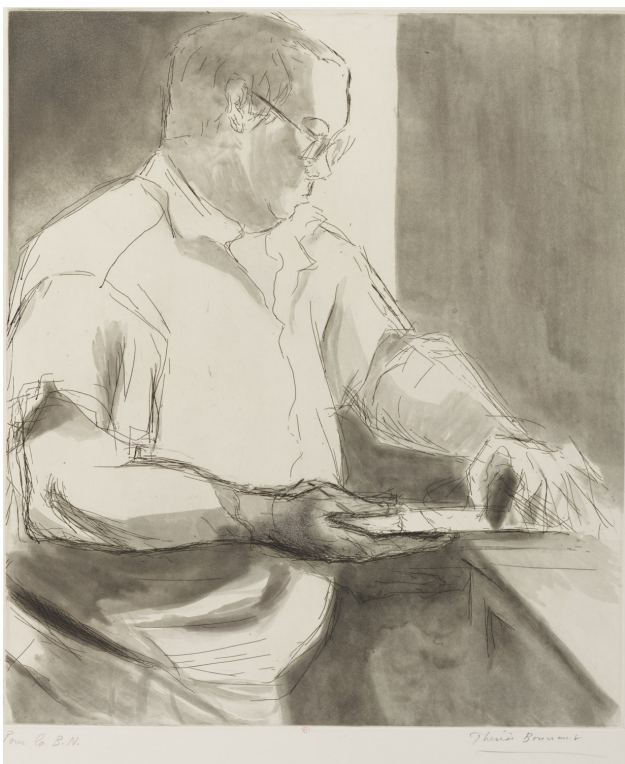
Ill. 8. Thérèse Boucraut, René Tazé dans son atelier , eau forte et aquatinte 2011, 76,2 x 55,8 cm. BnF, Estampes, Dg-1 (Boucraut, Thérèse)-FT5