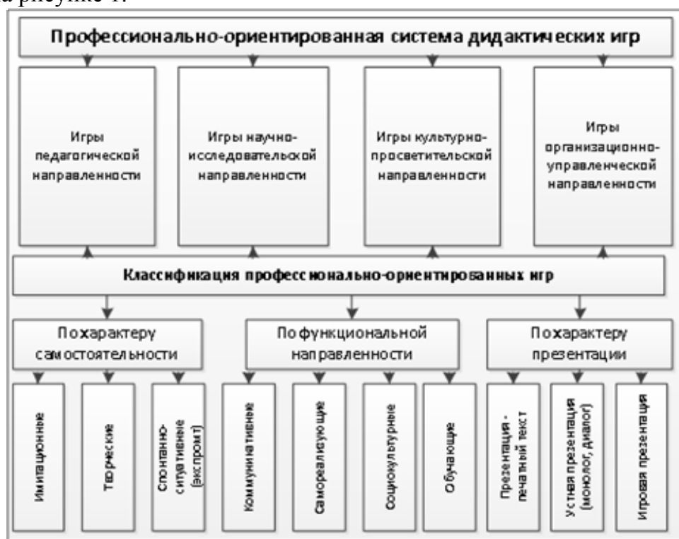
Рис. 1 - Профессионально-ориентированная система дидактических игр

Схема профессионально-ориентированной системы дидактических игр приведена на рисунке 1.