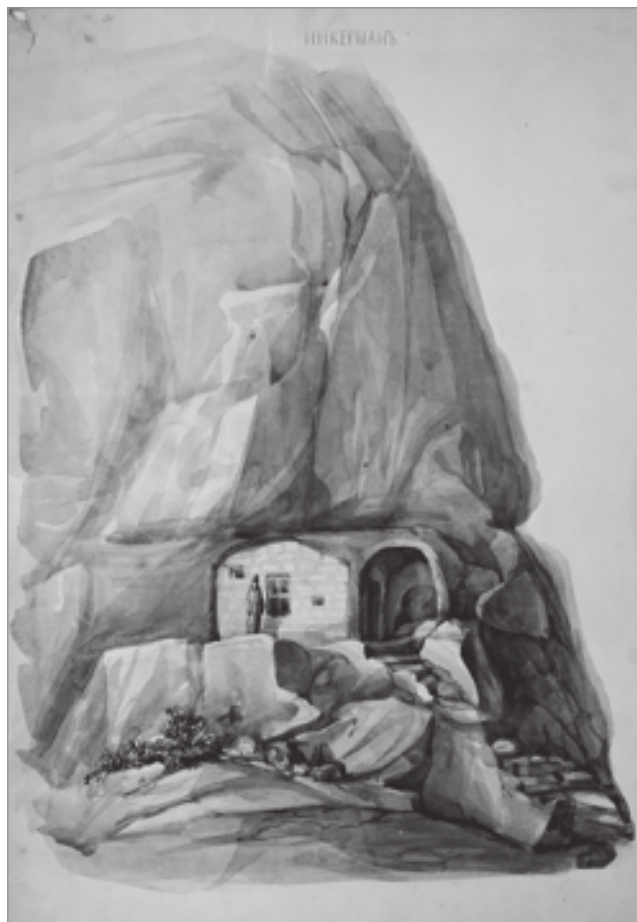
Инкерман. Вход в церковь Св. Климента