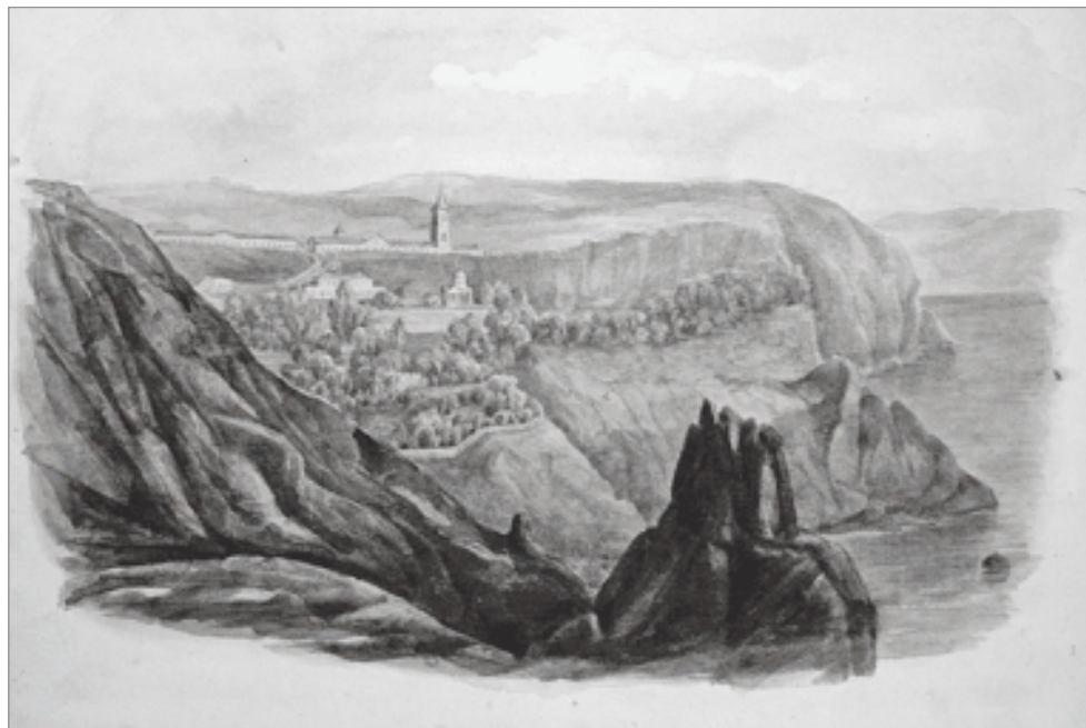
Балаклавский Свято-Георгиевский монастырь