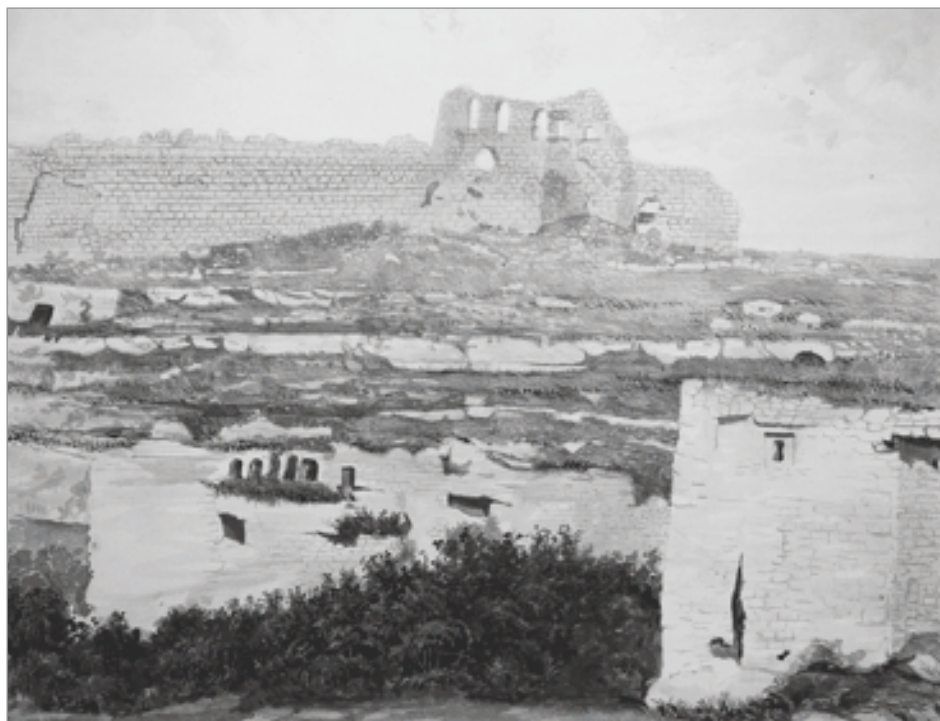
Пещерный город Мангун-Кале

К сожалению, состояние многих листов на сегодняшний день крайне плачевно: сильное загрязнение, сгибы, отверстия от кнопок в уголках листов, разрушение бумаги. Вероятно, они активно использовались самим создателем. Можно предположить, что именно эти рисунки были