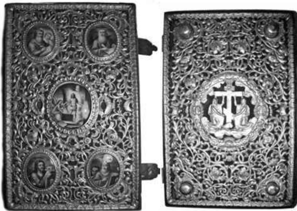
Оклад напестольного Евангелия (АОКМ. Ед. хр. 7675 см.)

Обращает на себя внимание несоответствие числа персон, внесенных в списки, количеству подносимых комплектов книг: для 17 членов царской семьи было отправлено 18 комплектов (36 книг), а в Священный синод — 13 комплектов (26 экз.) вместо 12 [11, л. 36—36 об.]. С чем связано появление в обоих случаях дополнительного комплекта книг, кому он предназначался и у кого в