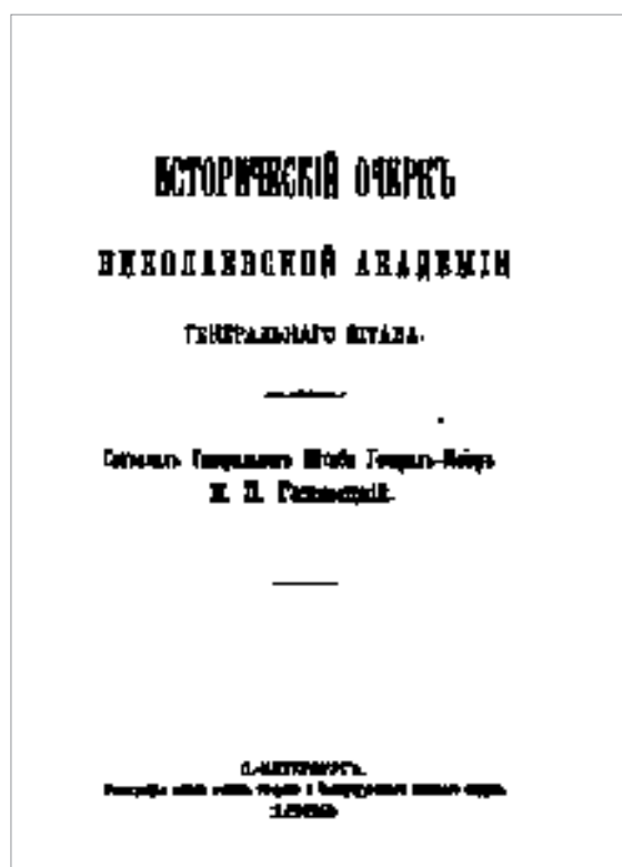
Исторический очерк Николаевской академии Генерального штаба. СПб., 1882. 101 с. Титульный лист

Библиотекарь академии по своему служебному и материальному положению находился в более выгодных условиях, чем библиотекарь Главного штаба. Имея казенную квартиру и будучи поэтому более обеспеченным в материальном плане, он и в отношении пенсии пользовался правами для учебного ведомства, т. е. имел право на нее через 25 лет службы. Библиотекари академии имели