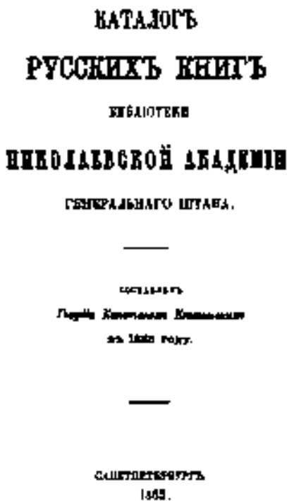
Каталог русских книг библиотеки Николаевской академии Генерального штаба. СПб., 1865. 188 с. Титульный лист

В библиотеке академии имелась книга учета заявлений. В нее вносились пожелания офицеров относительно приобретения новых книг, газет и журналов, предложения по улучшению качества обслуживания читателей. Она регулярно представлялась библиотекарем правителю дел академии, а тот в свою очередь периодически представлял ее начальнику академии. В «Правилах для библиотеки Николаевской академии Генерального штаба» существовало положение о том, что библиотека обязательно должна иметь лучшие библиографические указатели вновь появившихся русских и иностранных книг, которые должен был просматривать не только библиотекарь, но и правитель дел академии. Вновь приобретенные книги библиотекарь вносил в фундаментальный каталог книг и в инвентарь по книжным шкафам.