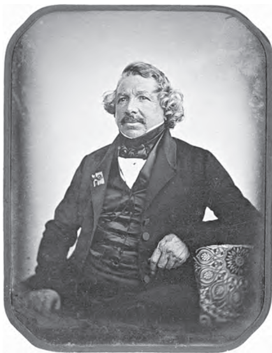
Луи Дагер. Дагеротип, 1844 г.

устройством для человека, или человеком для технического устройства). Начало положило в 1808 г. применение перфокарт, предназначенных для программирования сложных узоров в ткацких станках Ж. Жаккарда. Далее следовало появление фотоснимков, датированное в используемом источнике 1822 годом [17, с. 291].