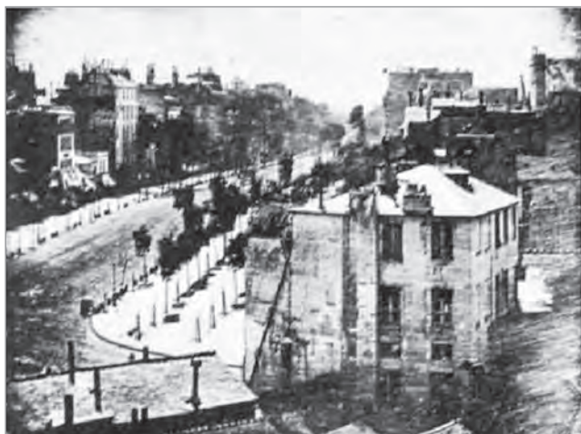
Л. Дагер. Бульвар Тампль в Париже. Дагеротип, 1839 г.

Не следует поспешно осуждать Дагера, так как имел место подписанный в 1837 г. договор с Исидором Ньепсом, согласно которому Дагер обязуется передать свое уже почти готовое изобретение «Товариществу», не раскрывая тайн технологии и при условии, что процесс будет носить его имя. Дальнейшая судьба изобретения известна. Справедливости ради следует лишь упомянуть, что заслуги Нисефора Ньепса отнюдь не были игнорированы французским государством: его наследник Исидор Ньепс также получил пожизненную пенсию, величина которой составляла около двух третей от пенсии Л. Дагера. Причем эта разница в пользу Дагера определялась не столько его достижениями в изобретении фотографической технологии, сколько согласием в дополнение к фотопроцессу открыть секреты устройства своей знаменитой диорамы [6, с. 4—20].