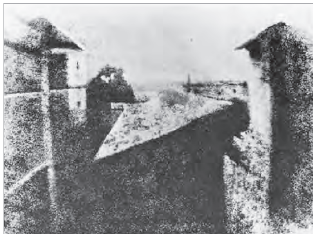
Н. Ньепс. Вид во двор. 1826—1827 гг.

(6—8 часов) экспонированию, затем изображение проявляется с помощью смеси нефти и лавандового масла, после чего травлением пластина превращается в «гравировальную доску», с которой после окончательной доработки печатаются оттиски. «Вид во двор» Н. Ньепса, снятый не позднее 1827 г., считается самой ранней сохранившейся фотографией.