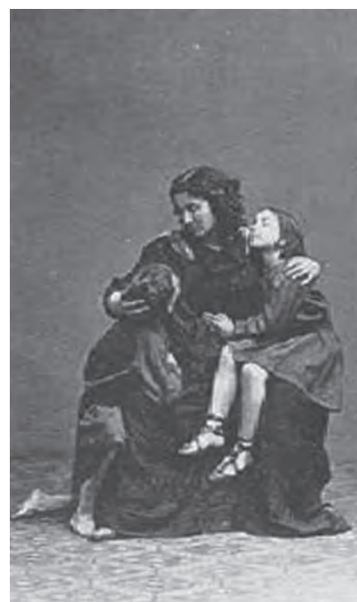
Фотография формата «визитная карточка»

всего В.В. Стасов, зафиксировали факт появления в России качественно нового зрителя, в том числе и новой читательской аудитории. Отмечалось, что меняется социальная ориентация искусства: из салонного оно становится общезначимым. Однако потребности этой новой массовой аудитории были слабо изучены и порой удивляли критиков эстетической «незрелостью», поскольку предпочтение отдавалось не правдивому, а «красивому» искусству [5, с. 8]. В связи с этим представляется особенно значимым факт, что работой ИПБ и ее отделов руководили люди такого высочайшего уровня образования и культуры, как М.А. Корф, В.И. Соболев и В.В. Стасов. Они, разумеется, не «шли на поводу» у массовой публики, а комплектовали фонды ценными фотодокументами самых различных видов и жанров.