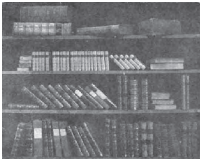
У. Тальбот. Книжная полка. 1840 г.