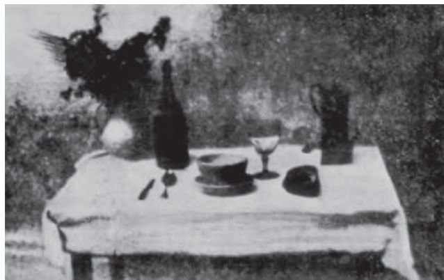
Н. Ньепс. Накрытый стол. Ок. 1829 г.