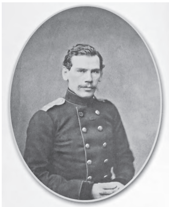
Портрет графа Л.Н. Толстого. «Светопись Левицкого», Санкт-Петербург, 1856 г. Из фондов ГИМ

Но для научного, документологического подхода такая широкая трактовка недопустима. Термин «фотография» (греч. — «световое письмо»)