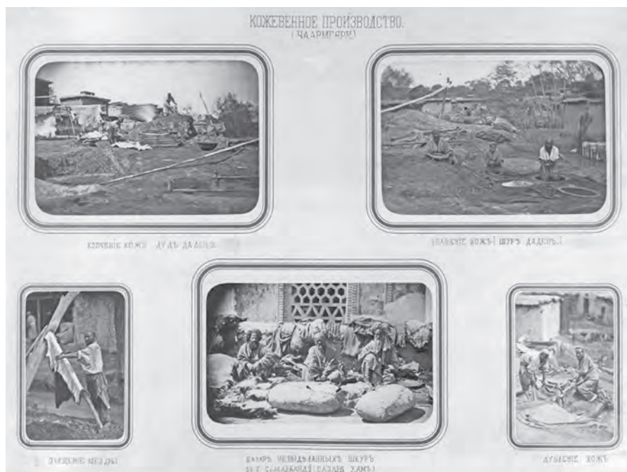
Один из листов «Туркестанского альбома»