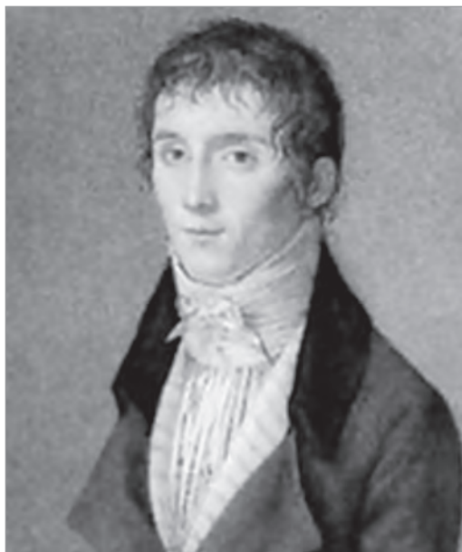
Нисефор Ньепс, ок. 1795 г.

Однако известно, что официальное объявление об изобретении дагеротипии было сделано много позже, лишь в 1839 году. Как объяснить эту разницу не на год, не на два, а на целых 17 лет? Действительно, о достижениях Луи Дагера было сообщено в 1839 г., но уже в 1841 г. Исидор Ньепс, сын Жозефа Нисефора Ньепса — коллеги и делового партнера Дагера — написал книгу «История открытия, несправедливо названного дагеротипом» [4, с. 339]. С тех пор не утихают споры: кого считать родоначальником фотографии, Нисефора Ньепса или Луи Дагера?