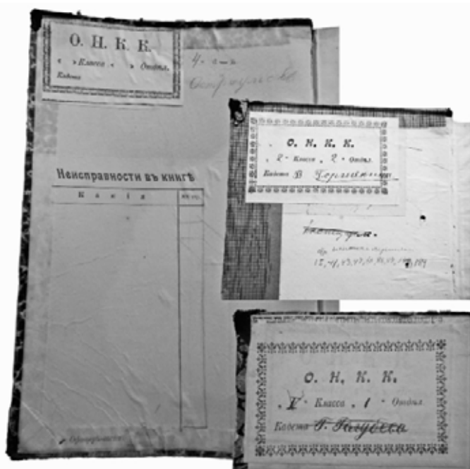
Вторые страницы обложек книг с пометками об их состоянии и бумажными ярлычками

военное казачье училище (1910), с целью подготовки офицеров для всех казачьих войск России, кроме Донского, имевшего свое училище в Новочеркасске. Срок обучения составлял два года. При училище имелся приготовительный класс для взрослых малограмотных казаков. Сословных ограничений при поступлении не устанавливалось. В 1901 г. училище стало трехклассным и в него перевели казачий отдел Иркутского юнкерского училища.