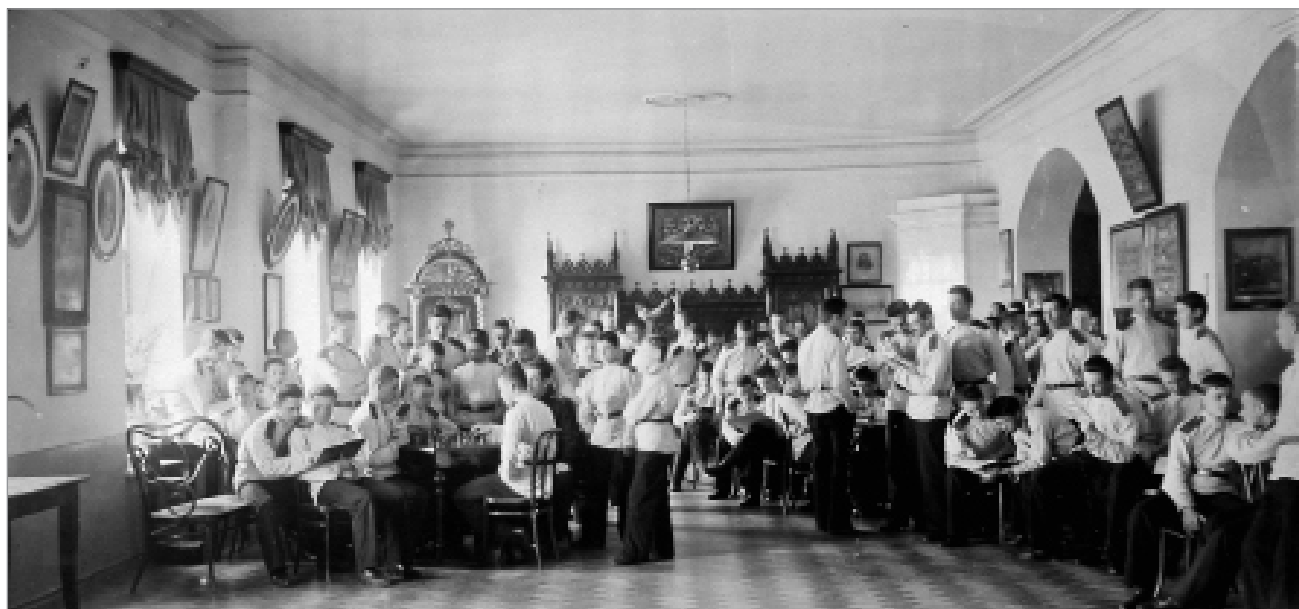
Кадеты 1-й роты Оренбургского Неплюевского кадетского корпуса в рекреационном зале в свободное от занятий время. Фото 1900-х годов

енного округа, в котором он особо отметил, что «училище роскошно снабжено всякими учебными пособиями» [30, с. 68].