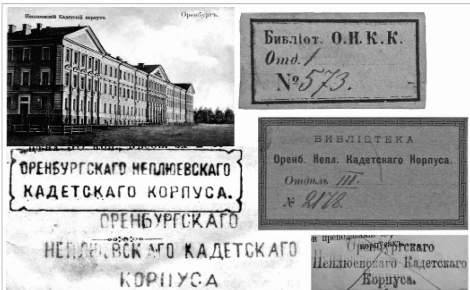
Бумажные ярлыки и штемпели библиотек Оренбургского Неплюевского кадетского корпуса

В 1867 г. по ходатайству генерал-губернатора Н.А. Крыжановского (1818—1888) открылось Оренбургское военное юнкерское училище, переименованное затем в казачье юнкерское училище (1878),