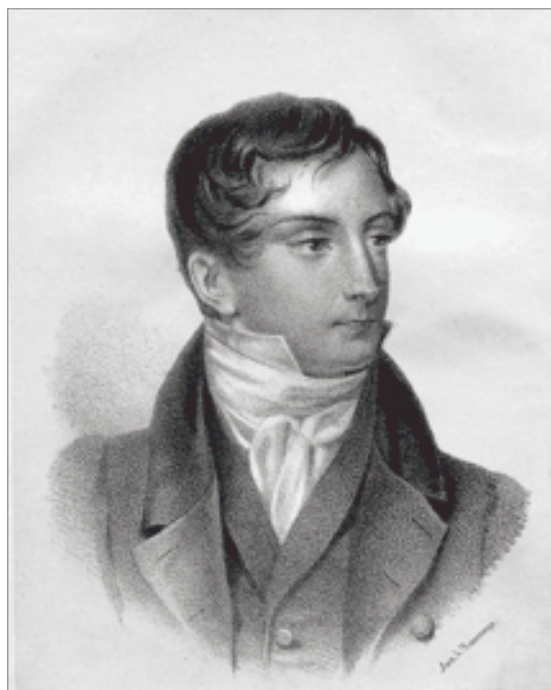
Д.В. Вeneвитинов. Литография А.М. Мюнстера с портрета П.Ф. Соколова. 1827 г.

В начале XIX в. воспитывалось новое поколение русской элиты, для которого характерны высокая степень гражданственности и прекрасное образование. Его представители, активные и полные творческих замыслов, считали, что будущее принадлежит именно «русским молодым людям, получившим европейскую образованность, опередившим, так сказать, свой народ и, по-видимому, стоящим мыслями наравне с веком и просвещенным миром» [33] и поставившим перед собой грандиозную цель — создать национальную культуру, равновеликую европейской. П.Н. Сакулин писал об этом времени: «К 20-м годам относятся первые, но уже горячие схватки классиков с “романтиками” (главным образом по поводу поэм А.С. Пушкина)... понемногу набирался сил литературный