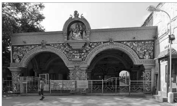
Библиотека Сарасвати Махал махараджи Серфоджи в Танджавуре

ученых и художников из разных стран; подлинными хранилищами бесценных книжных сокровищ стали многочисленные буддийские и индуистские монастыри, но, естественно, этот пласт духовной культуры был доступен лишь избранным [1].