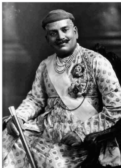
Саяджирао Гаеквад III, махараджа Бароды

Совершенно новый этап в развитии библиотечной системы Индии начался в 1947 г., после обретения страной независимости. К середине 1940-х гг.