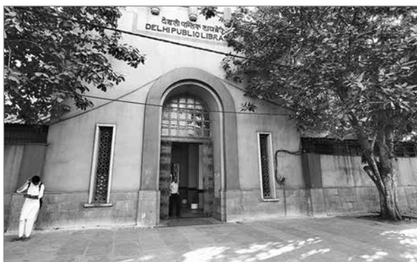
Публичная библиотека Дели

В 1957 г. был обнародован доклад специально назначенного правительством Индии комитета (комитет Сингха) о состоянии библиотечного дела в стране. Положение было признано «угнетающим», ибо большинство библиотек напоминали «стоячие болота» из-за отсутствия регулярных книжных поступлений. Отмечалось также, что библиотеки, обладающие большими коллекциями, не могут эффективно работать из-за старых жестких правил, в частности, требующих от читателей вносить крупный залог за пользование книгами, тем самым ограничивая доступ к фондам малоимущим. Согласно докладу, на март 1954 г. в Индии насчитывалось 32 тыс. библиотек с общим фондом около 7 млн 100 тыс. книг и книговыдачей около 37 млн 700 тыс. экземпляров. Качество оказываемых библиотечных услуг оценивалось