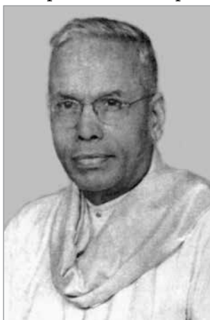
Шиали Рамамрита Ранганатан

как неудовлетворительное [1]. По результатам обследования был принят ряд принципиальных рекомендаций, определивших направления дальнейшего развития национальной библиотечной системы, среди которых: