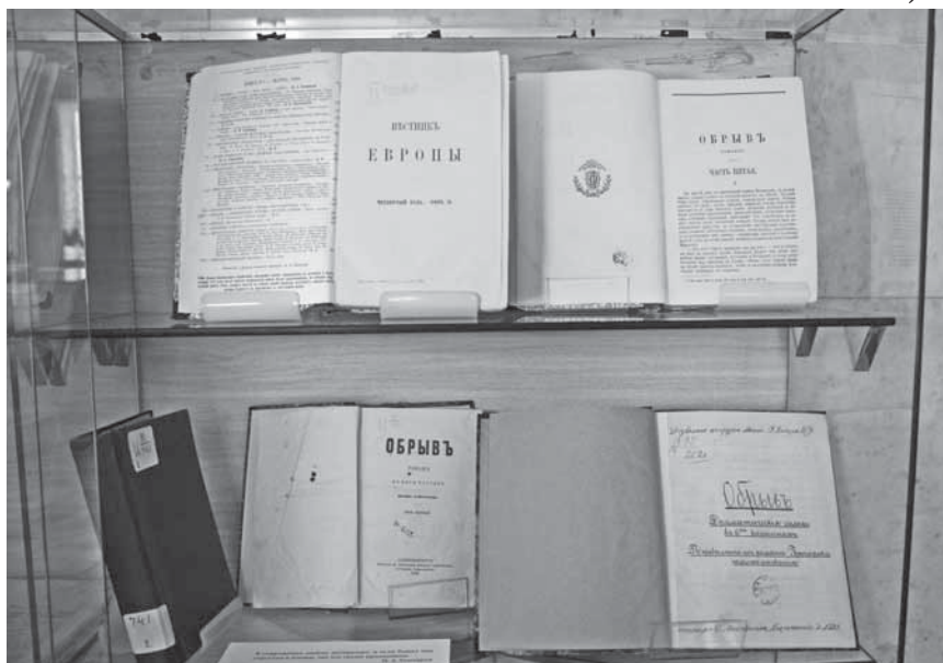
Первые публикации И.А. Гончарова

Отдельный раздел выставки посвящен изданиям собраний сочинений писателя, как прижизненным, так и первым пос-