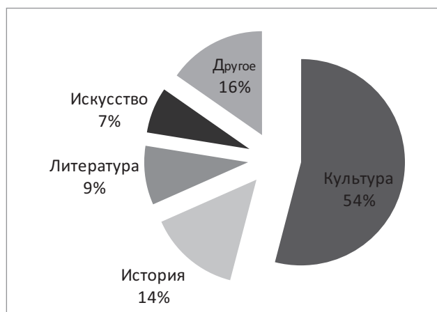
Рис. 3. Тематика издательской продукции библиотек (2012—2013 гг.)

Важную роль в активизации издательской деятельности библиотек сыграли современные издательские технологии, и в том числе технологии подготовки электронных изданий. Необходимо отметить, что создание электронных изданий требует особого опыта и навыков аналитической работы, связанных со структурированием инфор-