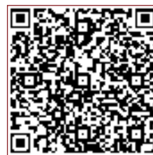
Видеозапись интернет- конференции

Участие в проекте библиотек будет определяться договорными отношениями с оператором НЭБ. Для того чтобы библиотека могла предоставить пользователям доступ к ресурсам, необходимо пройти процедуру регистрации IP-адреса библиотеки. Обязательность регистрации связана с тем, что в соответствии с Гражданским кодексом Российской Федерации библиотеки имеют право предоставлять доступ к цифровым документам, полученным законным путем и защищенным авторским правом, но только при соблюдении трех основных условий: доступ предоставляется на безвозмездной основе, без возможности создавать цифровую копию и только в помещении библиотек.