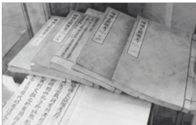
Дополненная Энциклопедия Восточного государства (китайский язык, ксилограф, без даты)

циональной цифровой библиотеки (НЦБ) Кореи в мае 2009 г. подтвердило главное направление усовершенствования библиотечных онлайн-услуг. В отличие от современных электронных библиотек, лишь предоставляющих доступ в режиме онлайн к хранящимся в библиотеке материалам, в