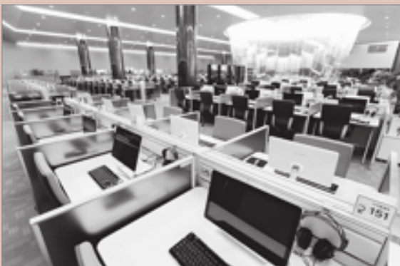
Читальный зал НЦБ Кореи

Национальная библиотека Кореи, открытая в 1945 г. в Сеуле, является крупнейшей библиотекой в Южной Корее. Ее фонд содержит 7 млн ед. хр., включая около 1 млн томов на иностранных языках. Некоторые книги из собрания библиотеки входят в список «Национальных сокровищ Южной Кореи». Комплектование фондов осуществляется путем получения обязательного экземпляра, через покупку, дарение, международный обмен.