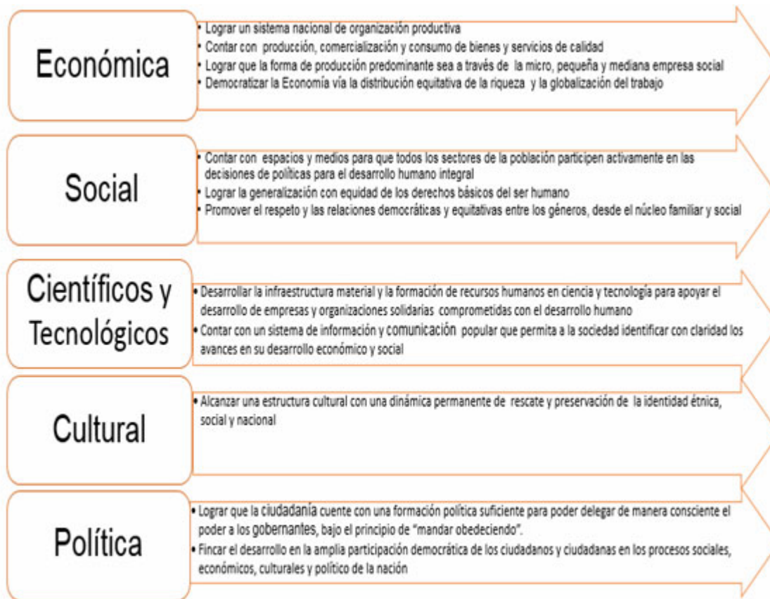
Figura 2. Dimensiones por Objetivos a considerar en la economía popular y solidaria (Fonteneau, Nyssens & Fall, 1999).

Es por ello que, en correspondencia con la concepción de EPS analizada, Fonteneau, Nyssens & Fall (1999) se identifican una serie de objetivos a desplegar en la realización de este tipo de forma económica que va a tributar al desarrollo local. Dichos objetivos se relacionan por dimensiones para lo cual se identifica la dimensión: económica, social, cultural y política (figura 2).