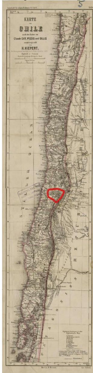
Figura 1. Departamento de Caupolicán en el siglo XIX

Fuente: Kiepert, H. (1857). Mapa editado por el autor de esta nota.