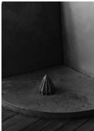
Detalle "Desayuno en México", hierro forjado y soldado, Ruben Schaap