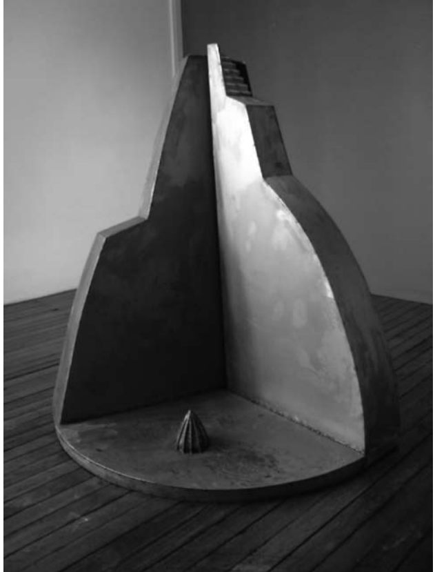
“Desayuno en México”, hierro forjado y soldado. Ruben Schaap

El grado GN, caso de estudio, pertenecía a la organización Proyecto GN (PGN) creada en el año 2000 por un grupo de maestros, directivos y referentes sanitarios y sociales para brindar servicio educativo a los niños que no asisten a la escuela a fin de integrarlos a ella. Con ese fin se articula el trabajo en el GN con actividades en la escuela primaria común de referencia (materias curriculares, actos, excursiones, etc.).