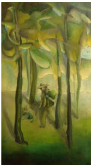
“Vago 2”, óleo. Jimena Cabello