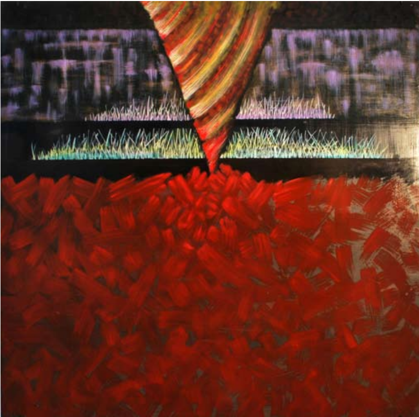
"Lecho ardiente" , óleo. Gustavo Gaggero