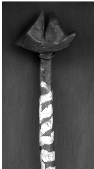
Detalle "Ave viajera", técnica mixta (madera, metal, cerámica, pintura acrílica). Noemí Fiscella