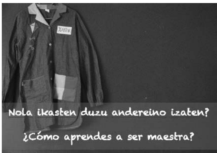
Ilustración 3: Cartel de la exposición temporal ¿Cómo aprendo a ser maestra? San Sebastián (España) 2014

La exposición temporal Bilakatuz (Casa de Cultura de Lugaritz), y la otra exposición “¿Cómo se aprende a ser maestra?” (Casa de Cultura de Aiete) se realizaron en San Sebastián. En ambos casos se contó con trabajos artísticos elaborados por estudiantes, maestras principiantes e investigadores en los que repensaban y expresaban las temáticas identitarias a través de pinturas, fotografías, murales digitales, instalaciones digitales o videoarte.